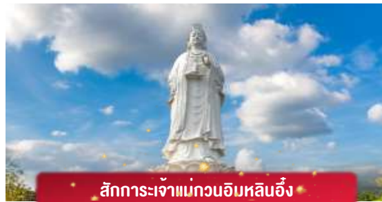
สักการะเจ้าแม่กวนอิมหลินอึ้ง

** ชำระค่าทัวร์ในนาม บริษัท นิดน้อย ทราเวล จำกัดเท่านั้น **