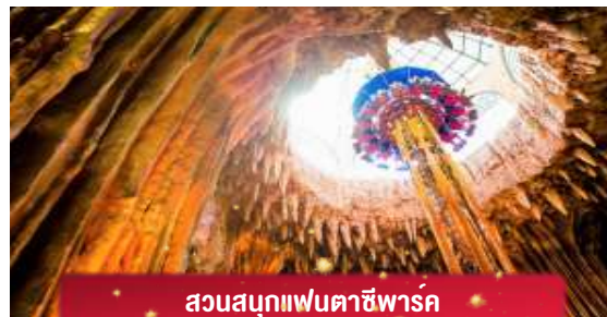
สวนสนุกแฟนตาซีพาร์ค

เช้า บริการอาหารเช้า ณ ห้องอาหารของโรงแรม อิสระท่านท่องเที่ยว สวนสนุกแฟนตาซีพาร์ค ซึ่งมีเครื่อง เล่นหลากหลายรูปแบบ เช่น ท่าอากาศยานมินิของหนัง 4D ระทึกขวัญกับบ้านผีสิง เกมส่นุกๆ เครื่องเล่นเบาๆ รถบัส หรือจะเลือกซื้อป๊องของที่ระลึกของสวนสนุก และ จัตุรัส แห่งดวงดาว เปรียบเสมือนการเดินทางสู่อาณาจักรแห่ง ดวงดาวที่มีเส้นทางเชื่อมต่อระหว่างอาณาจักรแห่งดวงจันทร์และอาณาจักรแห่งดวงอาทิตย์บนที่แสน งดงาม และสถาปัตยกรรมที่ล้ำสมัยจุดเด่นของที่แห่งนี้ก็คือกระจกใสทรงสามเหลี่ยมที่คล้ายกับ พีพีร์กัทลูฟวร์ที่ฝรั่งเศส ให้ความรู้สึกเหมือนท่านกำลังท่องอยู่ในโลกแห่งเวทมนต์และดวงดาว (ไม่ รวมค่าเข้าชมหุ่นยักษ์)