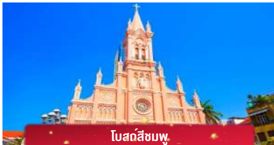
โบสถ์สีชมพู

ค่ำ บริการอาหารค่ำ ณ ภัตตาคาร พิเศษ ... เมนูบุฟเฟ่ต์ปิ้งย่าง ที่พัก MAGNOLIA HOTEL เทียบเท่าหรือระดับ 4 ดาวท้องถิ่น