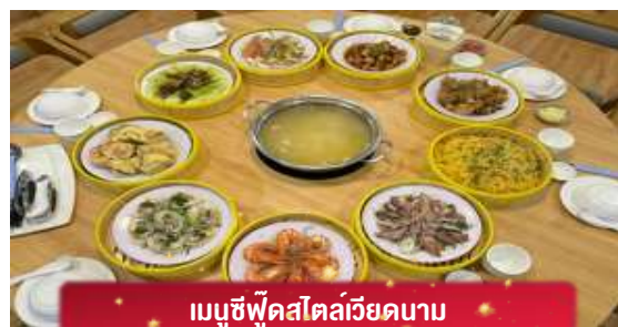
เมมูซีฟู้ดสไตล์เวียดนาม

17.05 เดินทางถึง สนามบินสุวรรณภูมิ โดยสวัสดิภาพ ... พร้อมความประทับใจ