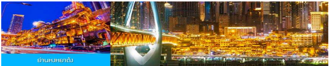
ย่านหนหยาดัง