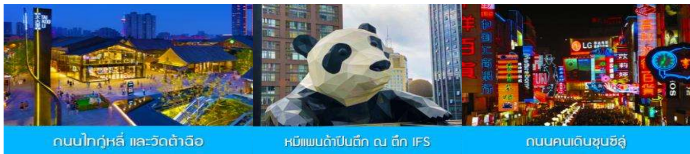
ถนนไท่กุ่หลี่ และวัดต้าเจี๊ว

พักที่ โรงแรม MULIAN ZHUANG HOTEL ระดับ 4 ดาวท้องถิ่น หรือเทียบเท่าในเฉิงตู