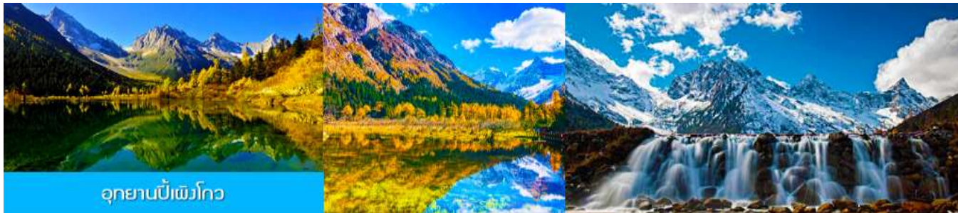
อุทยานบีเพิงโกว