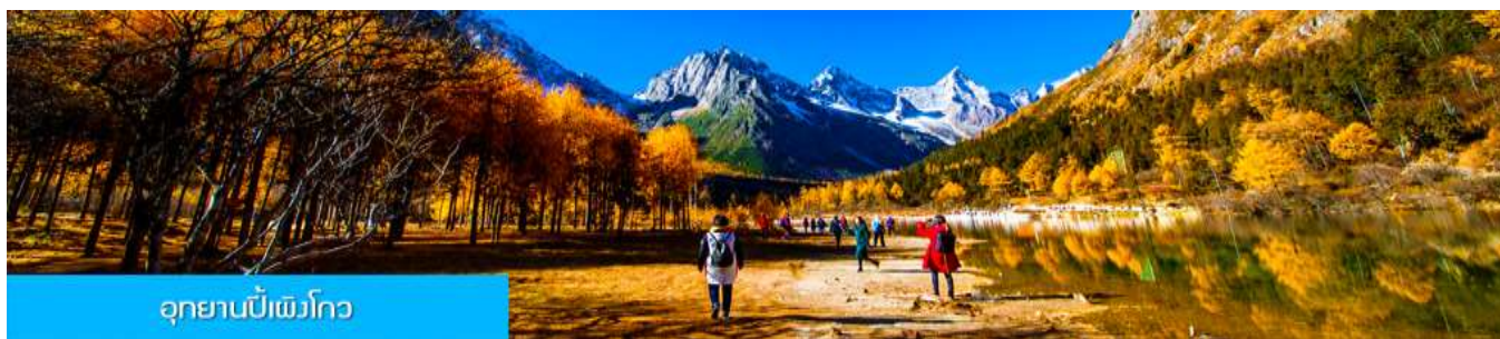
อุทยานบีเฟิงโกว

หลังอาหารนำท่านชม สะพานหนานเฉียว 南桥 สะพานโบราณคร่อมแม่น้ำตูเจียงเยียน ขึ้นชื่อที่ได้กลายเป็นแหล่งท่องเที่ยวสำคัญและจุดเช็คอินสำหรับนักท่องเที่ยว ในช่วงค่ำที่นี่ จะประดับประดาด้วยแสงสี บริเวณริมแม่น้ำจะถูกประดับด้วยแสงไฟสีฟ้าที่ทอดยาวไปตามแนวแม่น้ำ ชาวบ้านตั้งชื่อว่าเป็น น้ำตาสีฟ้า 蓝色眼泪 พักที่ โรงแรม HOLIDAY HOTEL & RESORT DUJIANGYAN ระดับ 4 ดาวท้องถิ่น หรือเทียบเท่าในเมืองตูเจียงเยียน