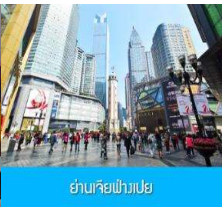
ย่านเจียฟ่างเปย