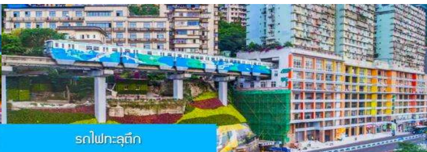
รถไฟฟ้าฉงชิ่ง

วันที่สี่ นครฉงชิ่ง-มหาศาลาประชาชน-รถไฟฟ้าฉงชิ่ง-ตึกตะเกียบ-อิสระช้อปปิ้งย่านเจียฟ่างเปย –เมืองตูเจียงเยียน – สะพานหนานเฉียว