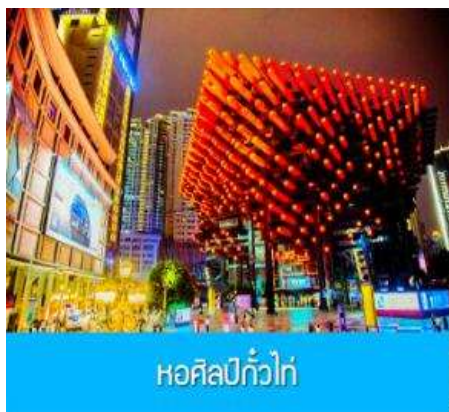
หอศิลป์กั๋วไท่