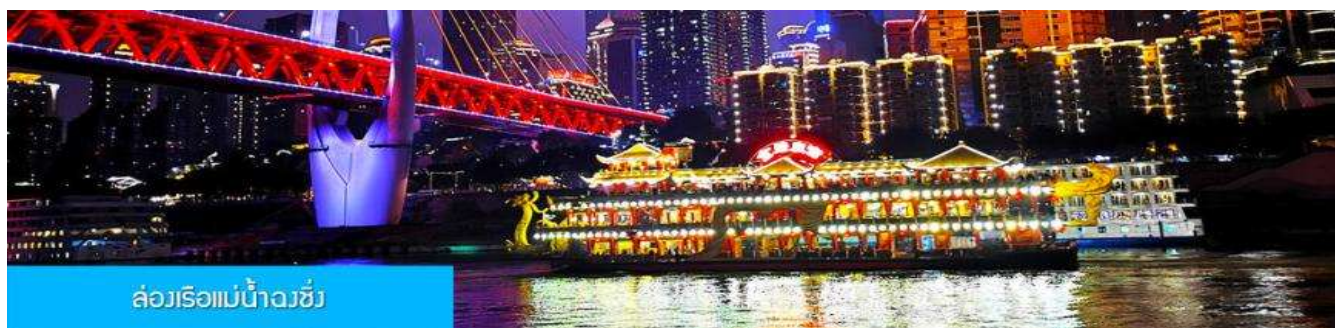
ล่องเรือแม่น้ำฉงชิ่ง

ค่ำ รับประทานอาหารค่ำ ณ ภัตตาคาร (6) (เมนูสุกี้หม่าล่าต้นตำหรับฉงชิ่ง)