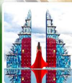
คาเฟ่ประตูสวรรค์