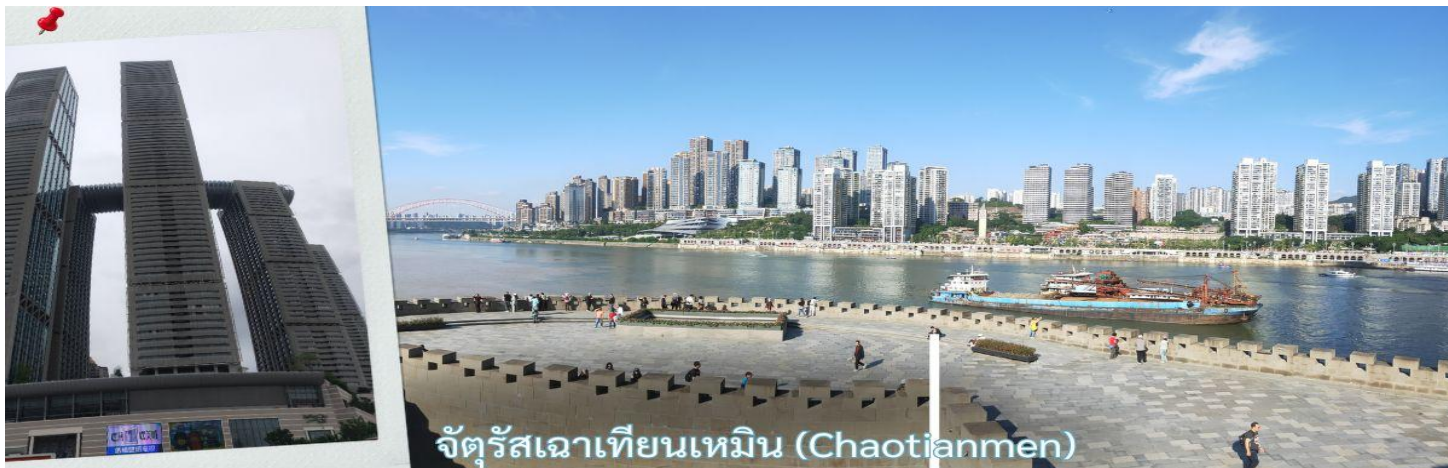
จัตุรัสเฉาเทียนเหมิน (Chaotianmen)

** ชำระค่าทัวร์ในนาม บริษัท นิดน้อย ทราเวล จำกัดเท่านั้น **