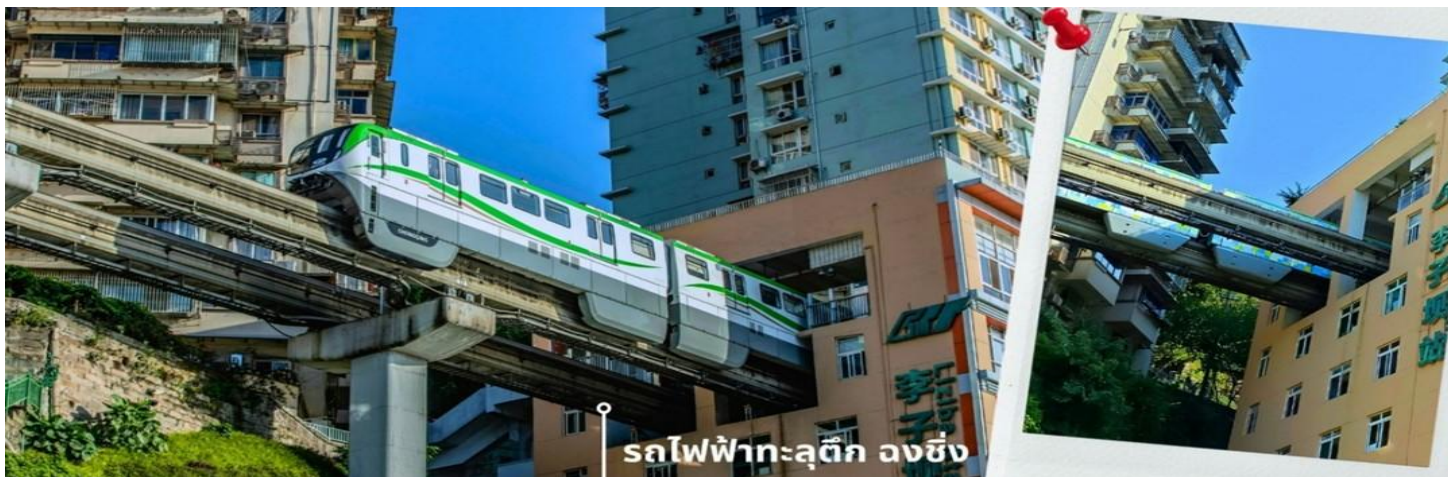
รถไฟฟ้าทะลุถ้ำ ฉงชิ่ง

** ชำระค่าทัวร์ในนาม บริษัท นิดน้อย ทราเวล จำกัดเท่านั้น **