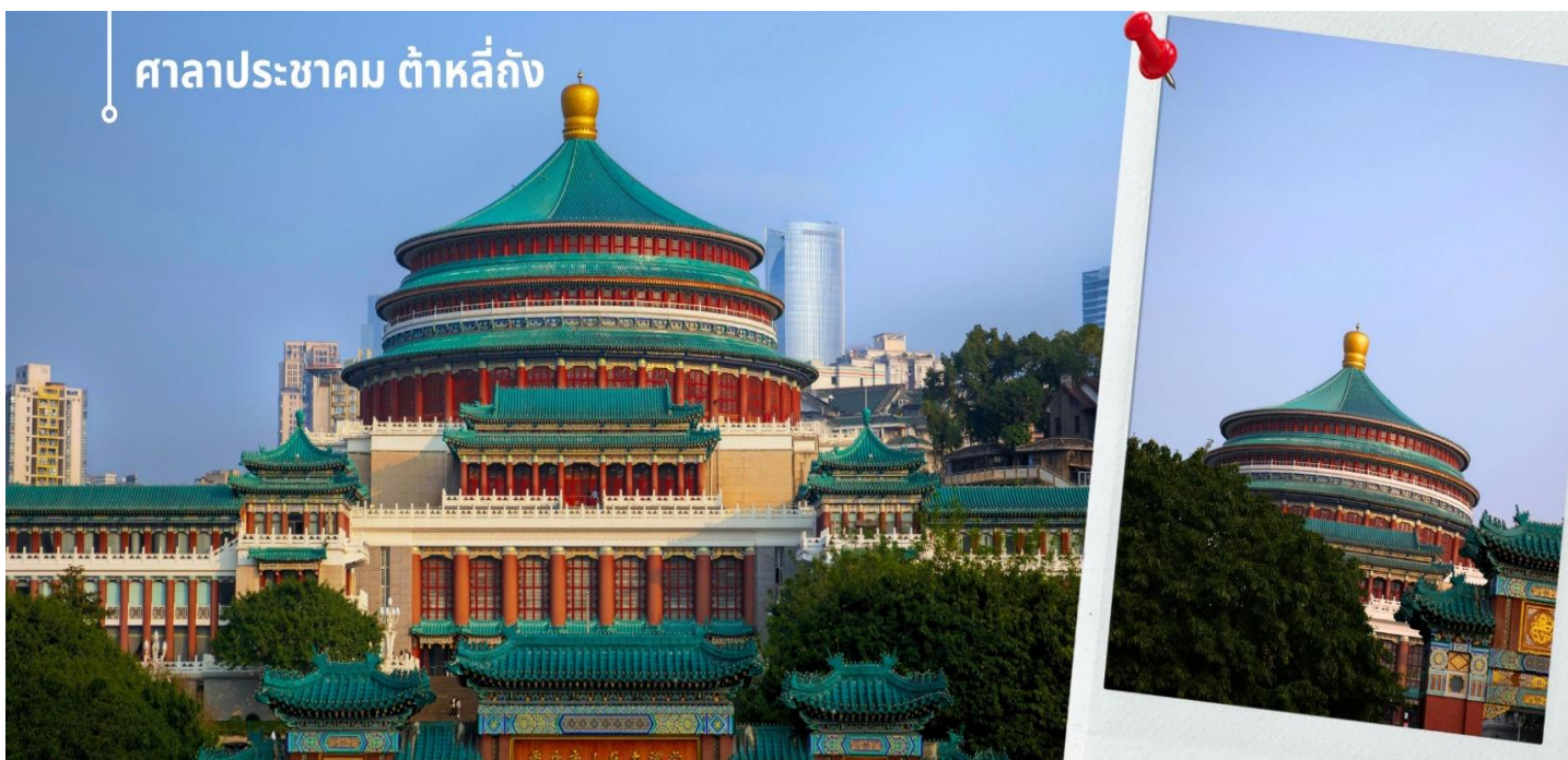
ศาลาประชาชน ต้าหลี่ถิ่ง

เที่ยง รับประทานอาหาร ณ ภัตตาคาร (6) นำท่านเดินทางสู่ ศาลาประชาชน (ด้านนอก) เป็นสถานที่หนึ่งในสัญลักษณ์ของเมืองฉงชิ่ง ด้วย สีส้มและรูปแบบการจัดวางอย่างโดดเด่นและลงตัว มีการผสมผสานของศิลปะในยุคราชวงศ์หมิง และราชวงศ์ชิงเข้าไว้ด้วยกัน ด้านหน้าจะเป็นลานกว้าง ในตอนเย็นและตอนกลางคืนจะมีผู้คน จำนวนมากเข้ามาชมตัวกันทำกิจกรรม ไม่ว่าจะเป็นการเต้นแอโรบิค เดินเล่น ปิกนิก เดินชมแสง ไฟยามค่ำคืน จัดนิทรรศการต่างๆ