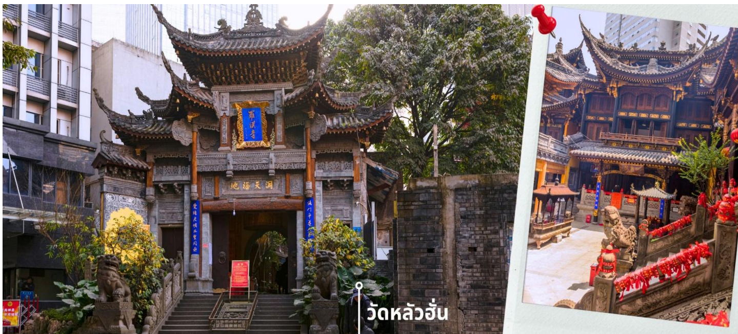
วัดหลัวฮั่น

นำท่านเดินทางสู่ วัดหลัวฮั่น (Luohan Temple) วัดสำคัญงานใหญ่พุทธสมาคมแห่งนครฉงชิ่ง เป็นวัดเก่าแก่ที่สุดในฉงชิ่ง (Chongqing) ซึ่งสร้างขึ้นเมื่อ 1,000 ปีก่อน มีประวัติความเป็นมา ยาวนานเป็นจุดหมายทางศาสนาและเป็นศูนย์กลางของชาวพุทธในภูมิภาคการท่องเที่ยวที่สำคัญ ของภูมิภาค และเป็นแหล่งเรียนรู้ที่สำคัญของศิลปวัฒนธรรมจีน วัดนี้ประดิษฐานพระอรหันต์ถึง 500 องค์ แต่ละองค์มีลักษณะ ท่าทาง และสีหน้าแตกต่างกัน มีสถาปัตยกรรมแบบจีนโบราณที่ สวยงามและละเอียดอ่อน พระอรหันต์ 500 องค์ แกะสลักด้วยหินและไม้ สะท้อนถึงความเชื่อใน พุทธศาสนาและฝีมือศิลปะจีน