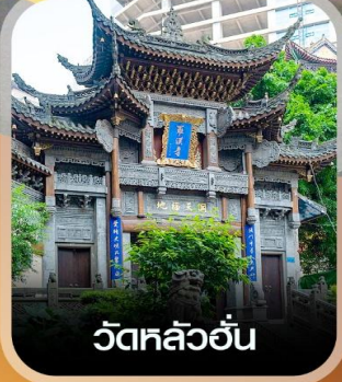
วัดหลิวอัน