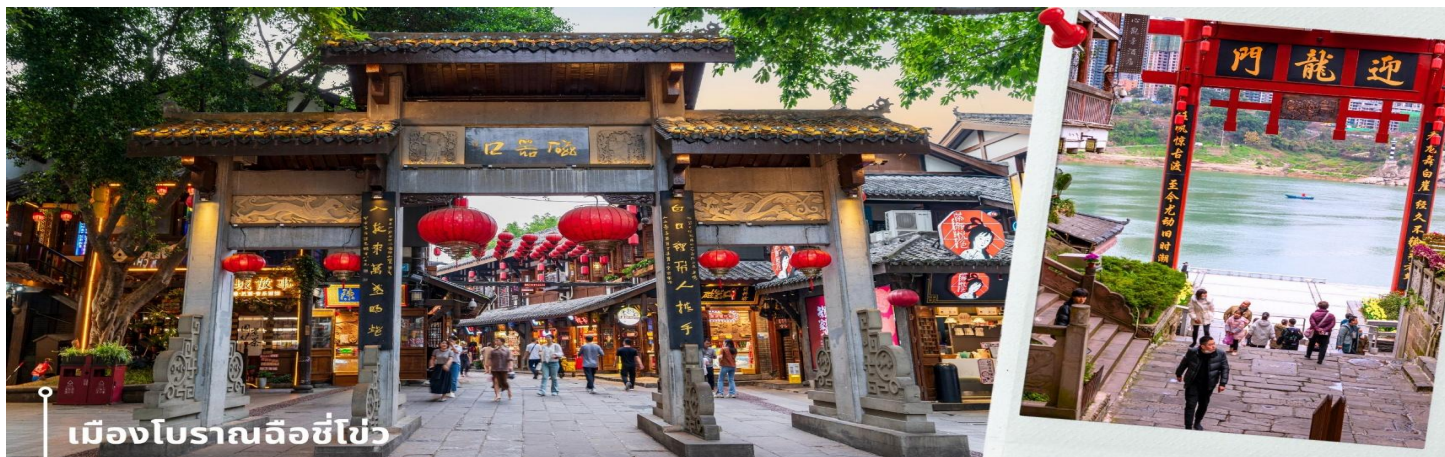
เมืองโบราณฉือชี่โข่ว

** ชำระค่าทัวร์ในนาม บริษัท นิดน้อย ทราเวล จำกัดเท่านั้น **