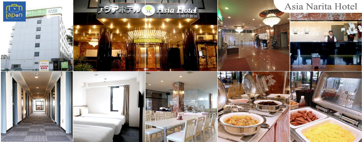
Asia Narita Hotel

ASIA HOTEL NARITA หรือเทียบเท่าระดับเดียวกัน