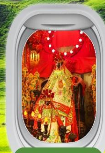
เจ้าแม่กวนอิมสองอำ