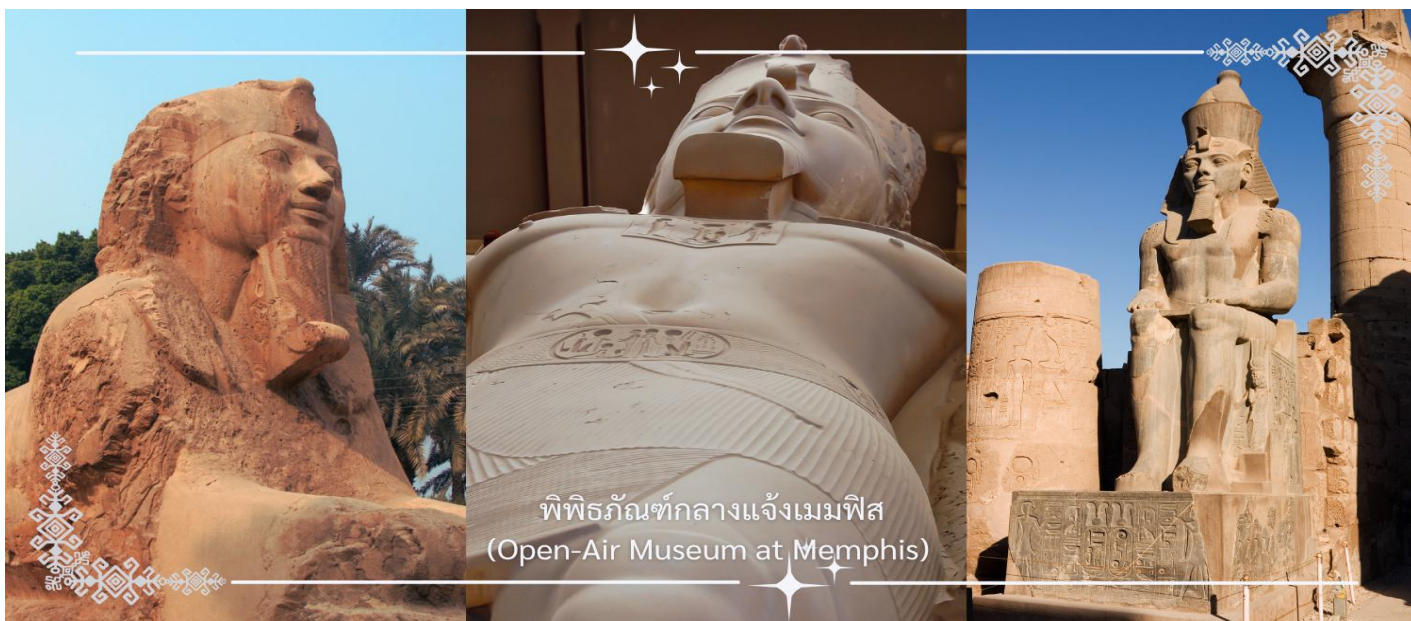
พิพิธภัณฑสถานกลางแจ้งเมมฟิส (Open-Air Museum at Memphis)

** ชำระค่าทัวร์ในนาม บริษัท นิดน้อย ทราเวล จำกัดเท่านั้น **