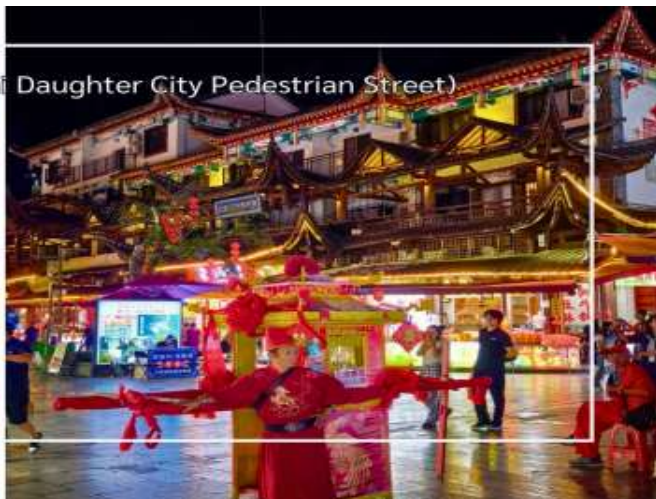
ถนนคนเดินเมืองลูกสาวเอ็นชือ (Enshi Daughter City Pedestrian Street)

เย็น บริการอาหารเย็น ณ ภัตตาคาร (มื้อที่8) จากนั้นเดินทางเข้าสู่โรงแรมที่พัก Ramada Hotel Xuan'en ระดับ 4 ดาว หรือเทียบเท่า