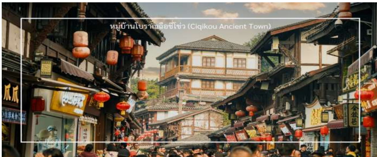
หมู่บ้านโบราณฉือชิว (Ciqikou Ancient Town)

** ชำระค่าทัวร์ในนาม บริษัท นิดน้อย ทราเวล จำกัดเท่านั้น **