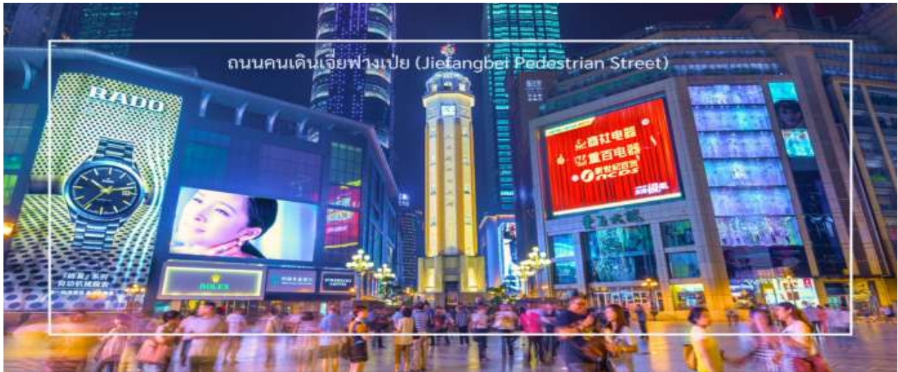
ถนนคนเดินเจียงเป่ย์ (Jiefangbei Pedestrian Street)

** ชำระค่าทัวร์ในนาม บริษัท นิดน้อย ทราเวล จำกัดเท่านั้น **