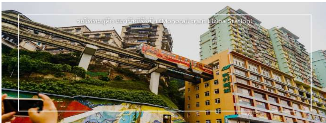
รถไฟทะลุตึก สถานีลิซิบ่า (Monorail train Liziba Station)

นำท่านชม รถไฟทะลุตึก (Monorail Train) หนึ่งในแลนด์มาร์กที่สะท้อนความทันสมัยและเอกลักษณ์ของเมืองฉงชิ่ง รถไฟฟ้าโมโนเรลสาย 2 วิ่งทะลุผ่านตัวอาคารสูงอย่างน่าทึ่ง ซึ่งเป็นวิศวกรรมการสร้างสุดแปลกตา กลายเป็นปรากฏการณ์ที่โด่งดังระดับโลก ท่านสามารถชมและถ่ายภาพโมเมนต์สุดล้ำนี้จากมุมต่างๆ ของเมือง จุดชมวิวนี้นั้นไม่เพียงสร้างความตื่นตาตื่นใจ แต่ยังเป็นสัญลักษณ์ของการผสมผสานระหว่างเมืองสมัยใหม่กับภูมิประเทศที่มีภูเขาและแม่น้ำรายล้อม