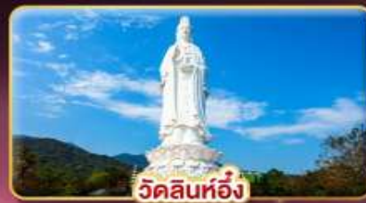
วัดลินท็อง