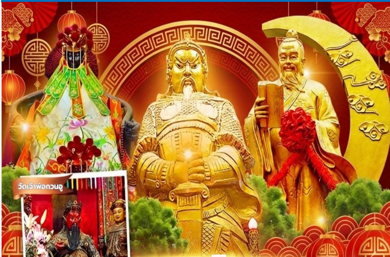
วัดเจ้าพ่อกวนอู