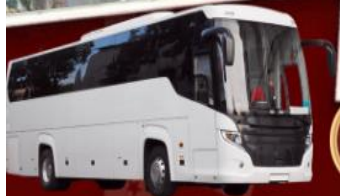
เดินทาง ก.พ. - ส.ค. 69