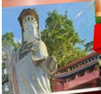
องค์จำลองสั้น