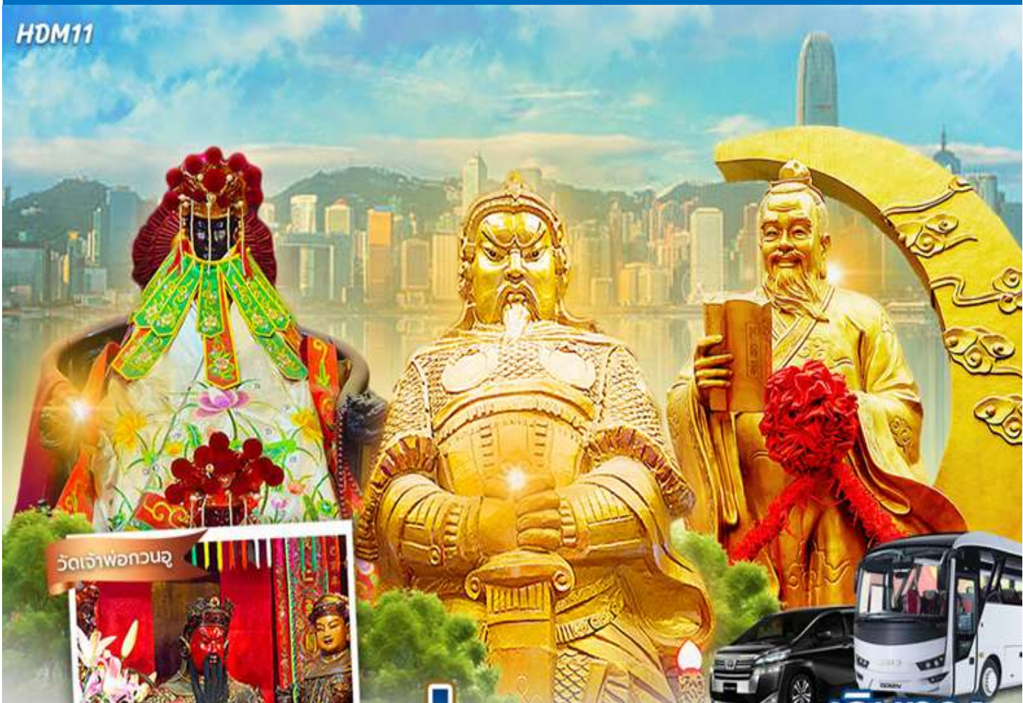
วัดเจ้าพ่อกวนอู