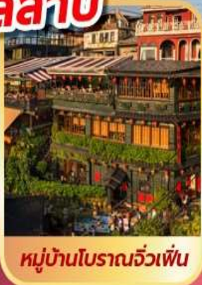
หมู่บ้านโบราณจิว่เฟิ่น