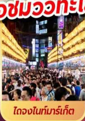
ไถจงไนท์มาร์เก็ต