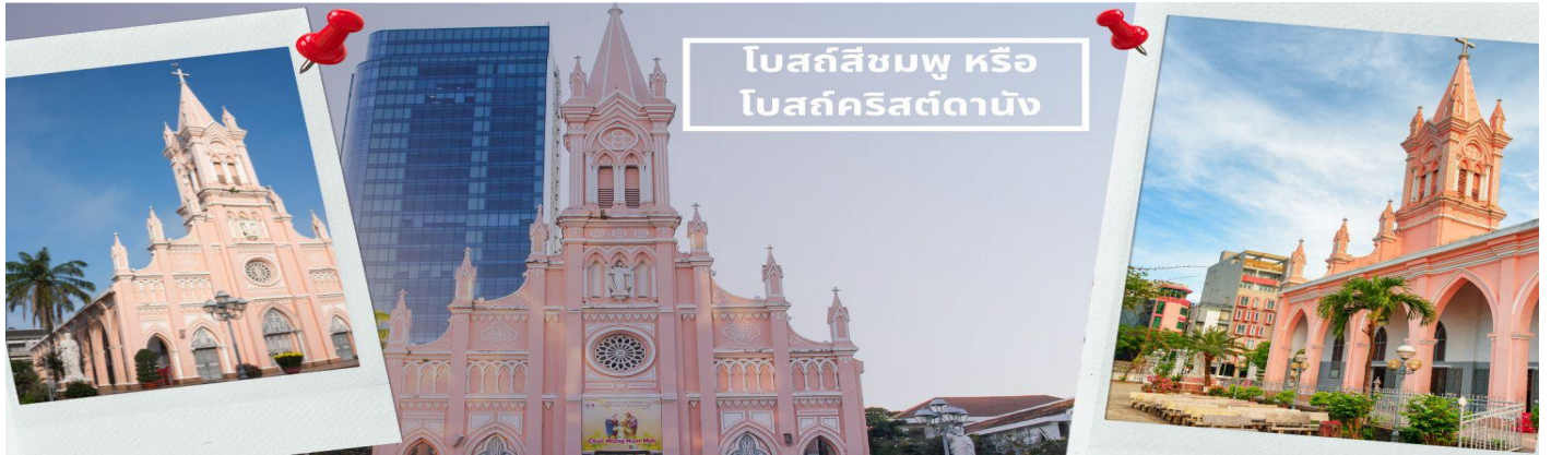
โบสถ์สีชมพู หรือ โบสถ์คริสต์ดานัง

** ชำระค่าทัวร์ในนาม บริษัท นิดน้อย ทราเวล จำกัดเท่านั้น **