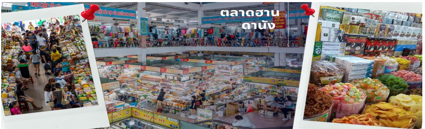
ตลาดฮาน ดานัง

จากนั้นนำท่านไป โบสถ์สีชมพู หรือ โบสถ์คริสต์ดานัง (Danang Cathedral) เป็นโบสถ์ที่มีความสำคัญเนื่องจากเป็นจุดเริ่มต้นของศาสนาคริสต์ในเวียดนาม สร้างขึ้นในสมัยที่เวียดนามตกเป็นอาณานิคมของฝรั่งเศสเป็นสถาปัตยกรรมในสไตล์โกธิก พร้อมด้วยการตกแต่งอย่างสวยงามประณีต ที่สำคัญคือเป็นโบสถ์สีชมพูพาสเทลทั้งหลัง ตัดขอบด้วยสีขาว ดูละมุนตาสุดๆ นำท่านไปละลายทรัพย์ที่ ตลาดฮาน ดานัง เป็นตลาดที่รวบรวมสินค้ามากมายเป็นที่นิยมทั้งชาวเวียดนามและชาวไทย อาทิ เสื้อเวียดนาม หมวก รองเท้า กระเป๋า สินค้าพื้นเมือง โดยเฉพาะงานฝีมือ อาทิ ภาพผ้าปักมืออันวิจิตร โคมไฟ ผ้าปัก กระเป๋าปัก ตะเกียบไม้แกะสลัก ชุดอ่าวหย่า (ชุดประจำชาติเวียดนาม) ไว้เป็นที่ระลึกมากมายเพื่อฝากคนที่บ้าน