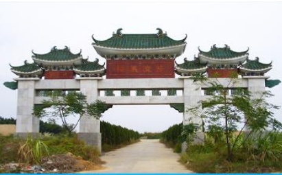
สุสานพระเจ้าตากสิน