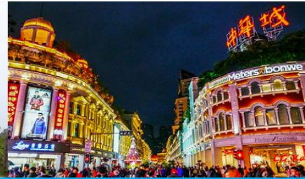
ถนนคนเดิน จงชานลู่

วันที่สี่ เมืองชวเถา – ศาลเจ้าแม่ทับทิม- สุสานพระเจ้าตากสิน– เมืองเซี่ยะเหมิน-ถนนคนเดิน จงชานลู่