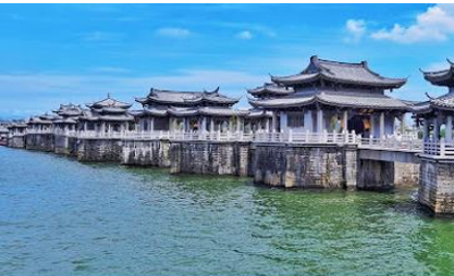
สะพานเชียงจื่อเจียว