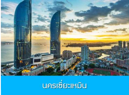
นครซีอะเหมิน

วันแรก คณะพร้อมกันที่สนามบินสุวรรณภูมิ 23.30 น. คณะเดินทางพร้อมกันที่ ท่าอากาศยานสุวรรณภูมิ อาคารผู้โดยสารขาออกชั้น 4 ประตูหมายเลข 10 เคาน์เตอร์ เช็คอิน สายการบิน XIAMEN AIRLINES (MF) เจ้าหน้าที่บริษัทฯ คอยให้การต้อนรับและอำนวยความสะดวกในการเช็คอิน