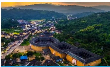
บ้านดินโบราณถู่ไหลวกาเป่ย

หลังอาหารนำคณะเดินทางสู่เมืองหย่งตั้ง 永定 ชมกลุ่มบ้านดินโบราณถู่ไหลวกาเป่ย 高北土楼群 เป็นบ้านดินโบราณของชาวจีนแคะที่สร้างขึ้นในยุคราชวงศ์หมิง ประกอบด้วยบ้านดินต่าง ๆ หลายหลัง อาทิ หอเจิ้งอีไหลว หู่หยุนไหลว ซื่อเจ้อไหลว ฯลฯ ได้รับสมญานามว่าเป็น ราชาแห่งบ้านดิน กลุ่มบ้านดินหลายหลังนี้เป็นบ้านพักอาศัยของชาวจีนแคะตระกูลเจียง 江氏 นำท่านเที่ยวชม บ้านดินเจิ้งอีไหลว 承启楼