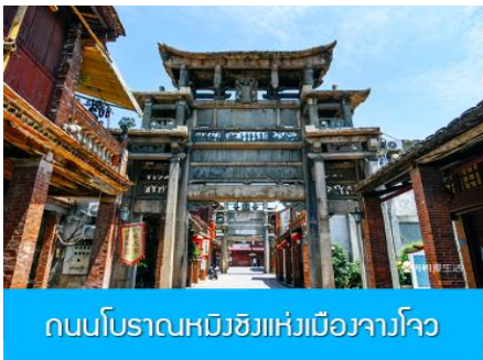
ถนนโบราณหมิงซิงแห่งเมืองจางโจว

เช้า รับประทานอาหารเช้า ณ ร้านอาหารของโรงแรม (1)