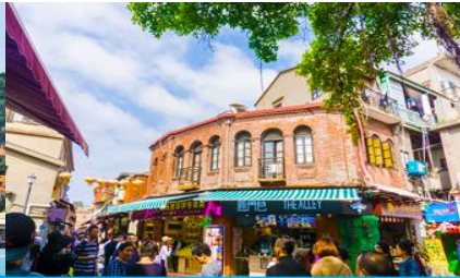
ถนนคนเดินหัวมังกร