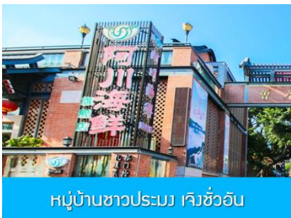
หมู่บ้านชาวประมง เจิ้งชวอัน