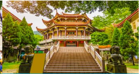
วัดหนานทิวซื่อ

วันที่ห้า เมืองเซี่ยเหมิน – เกาะกู่ล้งหยวี – สะพานบนทะเล – ถนนคนเดินหัวมังกร-วัดหนานผู้ถัว-หมู่บ้านชาวประมงเจิ้งชวอัน-ถนนวงแหวนรอบเกาะ -กรุงเทพฯ