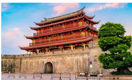
เมืองโบราณแต้จิ๋ว

พักที่ โรงแรม HAKKA TULOU PRINCE HOTEL 4* หรือเทียบเท่าในเมืองหย่งตั้ง