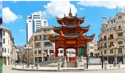
ย่านเมืองเก่าชิวเถา