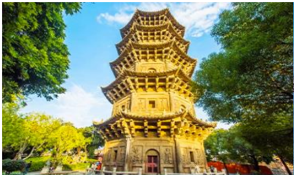
วัดโคหยวน