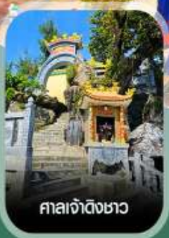
ศาลเจ้าดิ้งซา