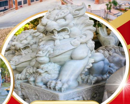
หมู่บ้านแกะสลัก

EMIRATES (EK) น้ำหนักกระเป๋า 30 กิโลกรัม พักโรงแรม 4 ดาว อาหารครบ 5 มื้อ แจกหมวกคนละ 1 ใบ