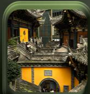
“ วัดหลัวฮั่น ”