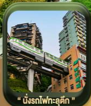
“ นั้งรถไฟคะลุดัก ”

บินตรงลงจงซิง • อุหลง หลุมฟ้าสะพานสวรรค์ • ระเบียบแก้ว • อุทยานเขานางฟ้า หงหยาดัง • นั้งรถไฟคะลุดัก • ศาลาประชาคม (ด้านนอก) • หลงหมินฮ่าว มรดกโลกผาหินแกะสลักต้าจู๋ • วัดหลัวฮั่น • ตึกตะเกียบ • ถนนคนเดินเจียฟางเปย์