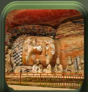
“ ผาหินแกะสลักต้าจู๋ ”