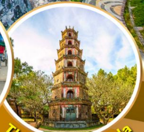
Thien Mu Pagoda