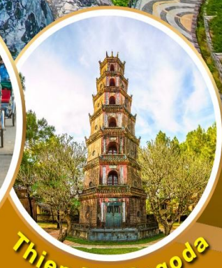
Thien Mu Pagoda