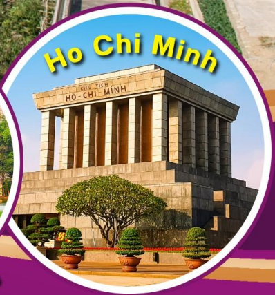
Ho Chi Minh