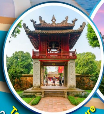
Temple of Literature