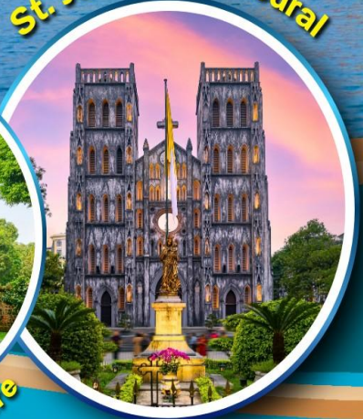
St. Joseph Cathedral