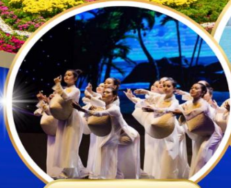
Charming Danang Show