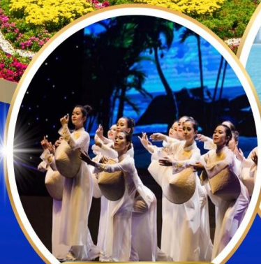
Charming Danang Show