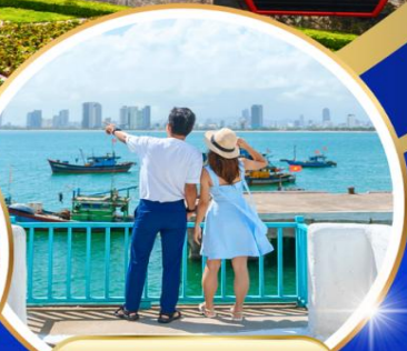
Son tra marina