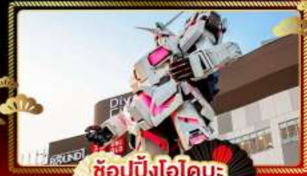
ช้อปปิ้งโอไดบะ