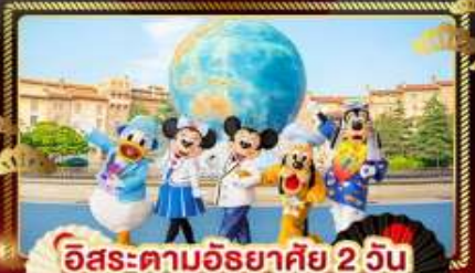
อิสระตามอริยาตีย์ 2 วัน