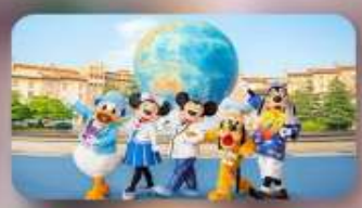
อิสระตามอัธยาศัย 2 วัน