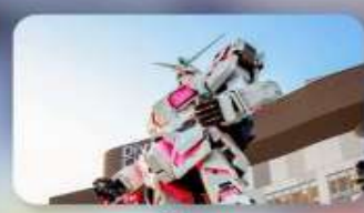
ชอปบิงไอโดะ