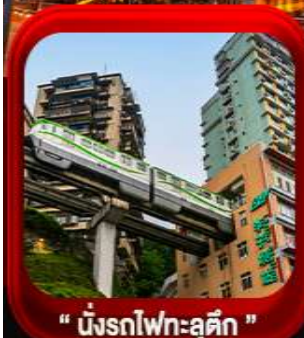
“ นิ่งรถไฟทง-ลู่ตีก ”

บินตรงลงฉิง • อุหลง หลุมฟ้าสะพานสวรรค์ • ระเบิดยงกั๋ว • อุทยานเขานางฟ้า หงหยาดัง • นิ่งรถไฟทง-ลู่ตีก • ศาลาประชาคม (ด้านนอก) • หลงหมินฮ่าว มรดกโลกผาหินแกะสลักต้าจู้ • วัดหลิวฮั่น • ตึกตะเกียบ • หมู่บ้านโบราณซือซี้ไจ๋