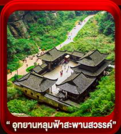
“ อุทยานหลุมฟ้าสะพานสวรรค์ ”

** ชำระค่าทัวร์ในนาม บริษัท นิดน้อย ทราเวล จำกัดเท่านั้น **