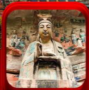
“ ผาหินแกะสลักต้าจู้ ”

บินตรงลงฉิง • อุหลง หลุมฟ้าสะพานสวรรค์ • ระเบิดยงกั๋ว • อุทยานเขานางฟ้า หงหยาดัง • นิ่งรถไฟทง-ลู่ตีก • ศาลาประชาคม (ด้านนอก) • หลงหมินฮ่าว มรดกโลกผาหินแกะสลักต้าจู้ • วัดหลิวฮั่น • ตึกตะเกียบ • หมู่บ้านโบราณซือซี้ไจ๋