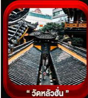
“ วัดหลิวฮั่น ”