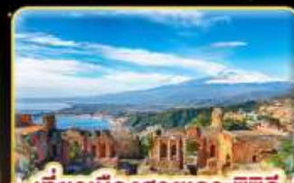
เที่ยวเมืองสวยเกาะซิชลี Taormina