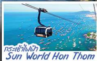
กระเช้าไฟฟ้้า Sun World Hon Thom