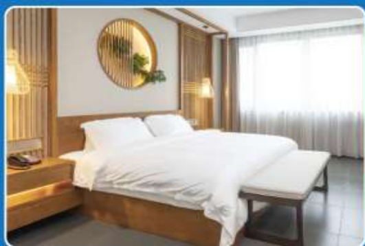
2 DOUBLE (DBL)