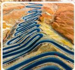
ถนนผานหลงกู่ต้าอว