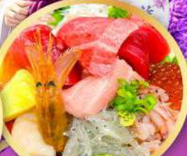
ตลาดปลาฮิมสุ คาชิโนะอิชิ

ถ่ายรูปเชคอินวิวฟูจิ กับชมประตูโทเซคิจิ แซนมอน