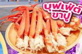
บุฟเฟ่ต์ ซาซู