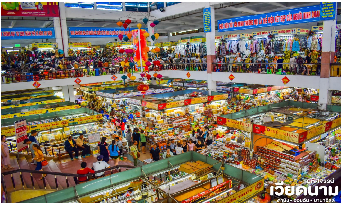
ปีทีจจรรย เวียดนาม ดานัง • ฮอยอัน • บานาฮิลส์

นำท่านเดินเที่ยวและช้อปปิ้งใน ตลาดฮาน ซึ่งก็มีสินค้าหลากหลายชนิด เช่นผ้า เหล้า บุหรี่ และของกินต่าง ๆ เป็นตลาดสดและขายสินค้าพื้นเมืองของเมืองดานัง