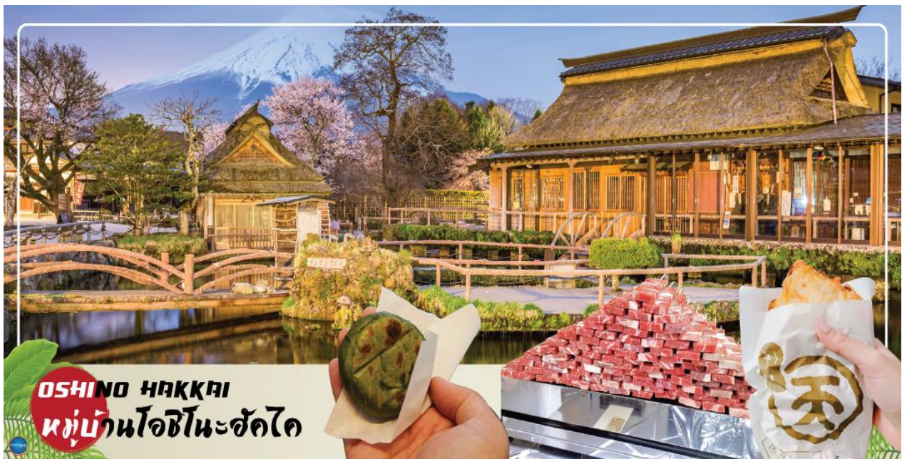
OSHINO HAKKAI หมู่บ้านโอชิโนะฮัคโค

ด้วย ภายในสวนมีจุดให้ถ่ายรูปมากมาย และยังมีสวนดอกไม้สไตล์อังกฤษที่มาพร้อมตัวละครมาสคอตสุดน่ารัก "Piter Rabbit English Gardent" และนอกจากนี้ยังมีคาเฟ่ไว้นั่งพักผ่อนชมวิวแบบชิลๆอีกด้วย ได้เวลาอันสมควรนำท่านเดินทางสู่ หมู่บ้านโอชิโนะฮัคโค (Oshino Hakkai) ให้ท่านเจาะลึกตามหาแหล่งน้ำบริสุทธิ์จากภูเขาไฟฟูจิ ที่เป็นแหล่งน้ำตามธรรมชาติตั้งอยู่ในหมู่บ้านโอชิโนะ จ.ยามานาชิ หรือพูดในทางกลับกันคือกลุ่มน้ำพุร้อนโอชิโนะฮัคโค เพียงก้าวแรกที่ย่างเท้าเข้าไปในหมู่บ้านก็สัมผัสได้ถึงอากาศบริสุทธิ์ และไอเย็นจากแหล่งน้ำธรรมชาติที่มีให้เห็นอยู่ทุกมุม โดยในบ่อน้ำใสแจ๋วมีปลาหลากหลายพันธุ์แหวกว่ายอย่างสบายอารมณ์ แต่ขอบอกเลยว่าน้ำแต่ละบ่อนั้นเย็นจับใจจนแอบสงสัยว่าน้องปลาไม่หนาวสะท้านกันบ้างหรือ เพราะอุณหภูมิในน้ำเฉลี่ยอยู่ที่ 10-12 องศาเซลเซียสนอกจากชมแล้วก็ยังมีน้ำพุจากธรรมชาติให้ตักดื่มตามอัธยาศัย และที่สำคัญ หมู่บ้านโอชิโนะยังเป็นแหล่งช้อปปิ้งสินค้าโอท็อปชั้นเยี่ยมอีกด้วย