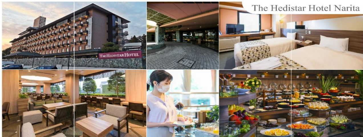
พักที่ THE HEDISTAR HOTEL NARITA หรือเทียบเท่าระดับเดียวกัน

** ชำระค่าทัวร์ในนาม บริษัท นิดน้อย ทราเวล จำกัดเท่านั้น **