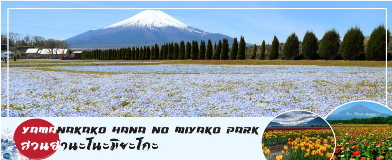
YAMANAKAKO HANA NO MIYAKO PARK สวนฮานะโนะมียะโกะ

08.00 น. เดินทางถึง ท่าอากาศยานนานาชาตินาริตะ ประเทศญี่ปุ่น นำท่านผ่านขั้นตอนการ ตรวจคนเข้าเมืองและศุลกากร เรียบร้อยแล้ว (เวลาที่ญี่ปุ่น เร็วกว่าเมืองไทย 2 ชั่วโมง กรุณาปรับนาฬิกาของท่านเพื่อความสะดวกในการนัดหมายเวลา) *** สำคัญมาก!! ประเทศญี่ปุ่นไม่อนุญาตให้นำอาหารสด จำพวก เนื้อสัตว์ พืช ผัก ผลไม้ เข้าประเทศ หากฝ่าฝืนมีโทษปรับและจับ