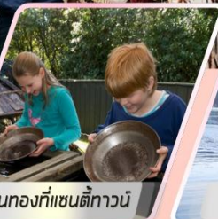
ร้อนทอที่แซนตีทาวน