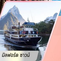
มิลฟอร์ด ซาวน์