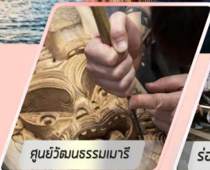
ศูนย์วัฒนธรรมมาเริ