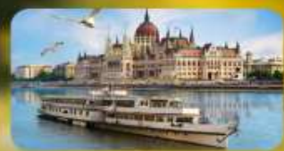
ส่องเรือแม่น้ำดานูบ พร้อมจิบแชมเปญ