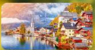
การันตีพัก Hallstatt / St. Wolfgang หรือริมทะเลสาบ 1 คืน