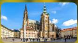
เข้าชม 2 ปราสาท ปราก และเซนต์บรูโน่