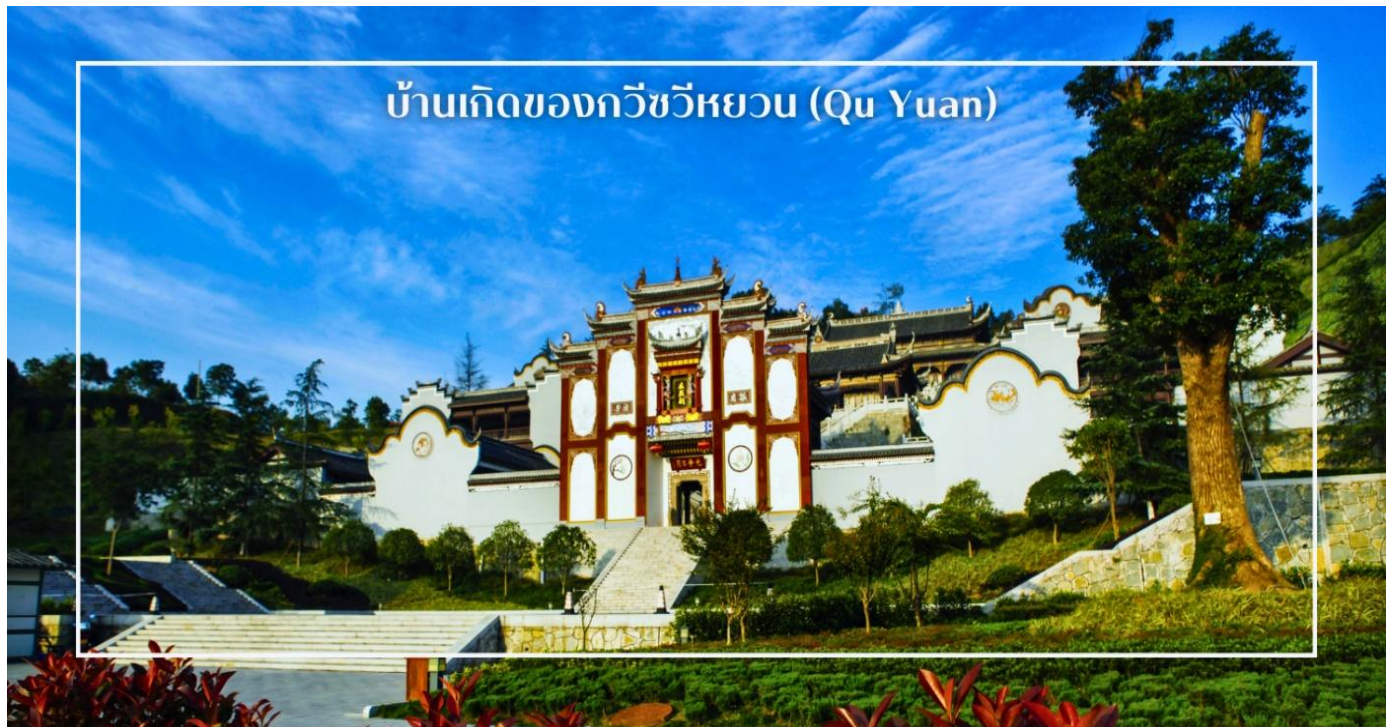
บ้านเกิดของกวีชวีหยวน (Qu Yuan)

นำท่านเดินทางสู่ บ้านเกิดของกวีชวีหยวน (Qu Yuan) สถานที่เกิดของบุคคลสำคัญทางประวัติศาสตร์และวรรณกรรมของประเทศจีน ผู้ได้รับการยกย่องว่าเป็นกวีผู้ยิ่งใหญ่แห่งยุครัฐจ้านกั๋ว และเป็นสัญลักษณ์แห่งความซื่อสัตย์และความจงรักภักดี บ้านเกิดของชวีหยวน ตั้งอยู่ริมแม่น้ำแยงซีเกียง เป็นสถานที่ที่สะท้อนเรื่องราวชีวิต แนวคิด และผลงานทางวรรณกรรมอันทรงคุณค่า ซึ่งมีอิทธิพลต่อวัฒนธรรมจีนสืบต่อมาจนถึงปัจจุบัน (รวมรถแบริดเตอร์รี่)