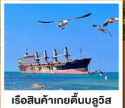
เรือสินค้าเกย์ตันบลูวิส