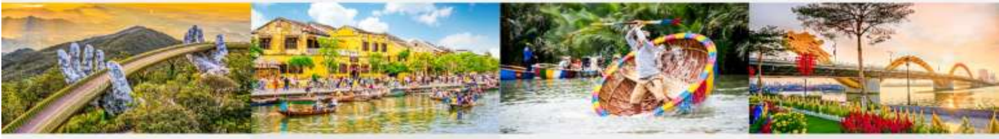
บานาฮิลล์ เมืองโบราณฮอยอัน ล่องเรือกระดัง สะพานมังกร

*กรณีห้องพัkbานาฮิลล์เต็ม ขอสงวนสิทธิ์ในการเปลี่ยนวันเข้าพัก และปรับเปลี่ยนโปรแกรมโดยคำนึงถึงผลประโยชน์ลูกค้าเป็นสำคัญ