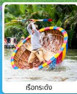
เรือกระดง