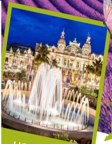
มอนติคาร์โร