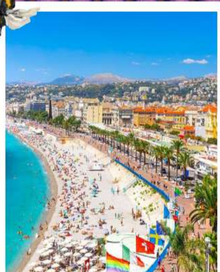
เฟรนช์ริเวียรา