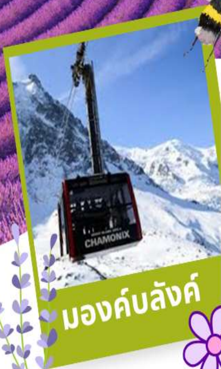
มองค์บลังค์