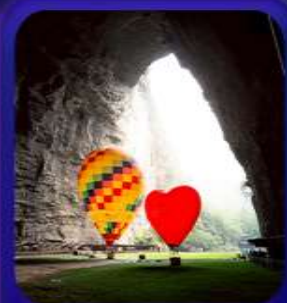
“ กำแพงหลง ”