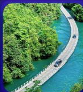
“ หุบเขาสิงโต ซ็องจื่อกวน ”