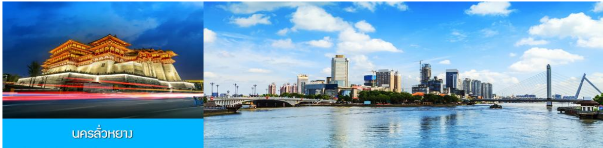
นครลั่วหยาง

** ชำระค่าทัวร์ในนาม บริษัท นิดน้อย ทราเวล จำกัดเท่านั้น **