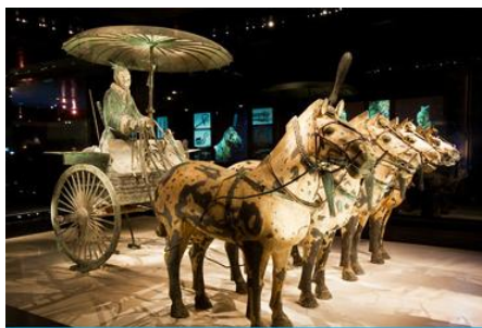
สุสานกองทัพทหารม้าจีนซี

รับประทานอาหารเช้า ณ ห้องอาหารของโรงแรม (4)