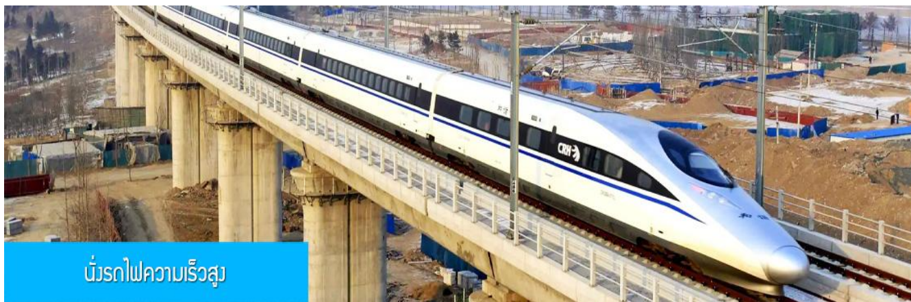
นั้รถไฟความเร็วสูง

หลังอาหารนำท่านเดินทางสู่สถานีรถไฟความเร็วสูงนครซีอาน เพื่อเตรียมเดินทางสู่ นครลั่วหยาง