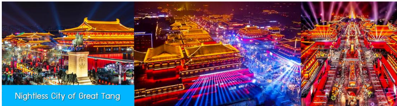
Nightless City of Great Tang

** ชำระค่าทัวร์ในนาม บริษัท นิดน้อย ทราเวล จำกัดเท่านั้น **