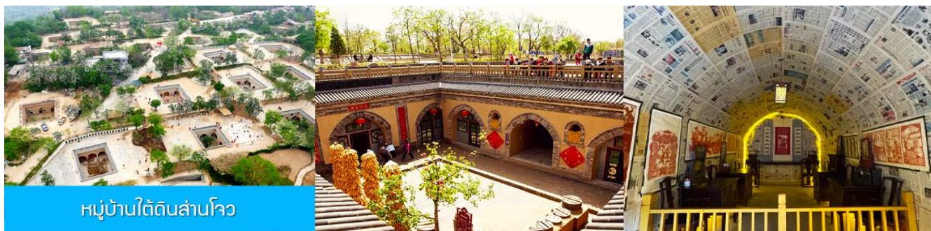
หมู่บ้านใต้ดินสามโจว

หลังอาหารนำท่านเดินทางสู่ เมืองซานเหมินเซี่ย 三门峡 (ระยะทาง 149 กม ใช้เวลาเดินทางราว 2 ชั่วโมง)