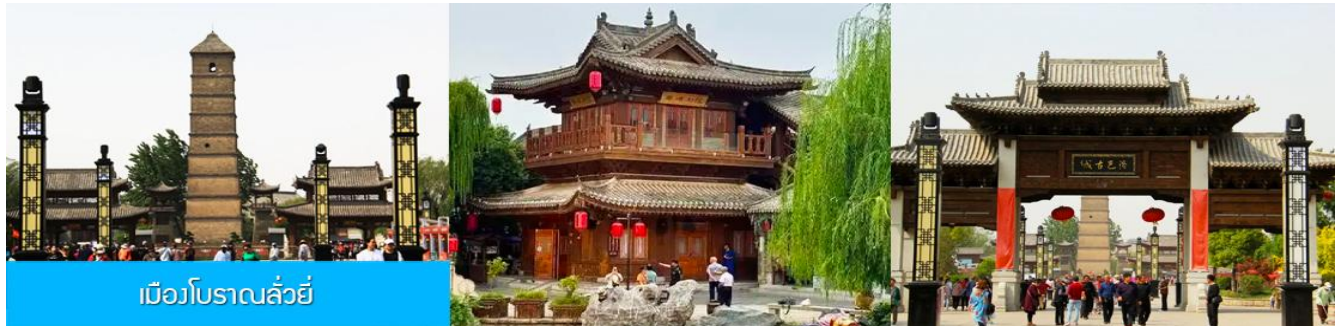
เมืองโบราณลั่วหยาง

** ชำระค่าทัวร์ในนาม บริษัท นิดน้อย ทราเวล จำกัดเท่านั้น **