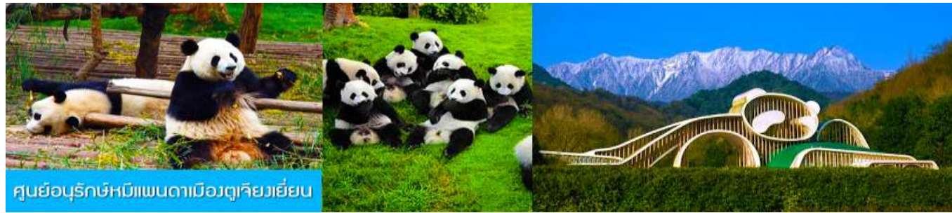
ศูนย์อนุรักษ์หมีแพนดามืองตูเจียงเยียน