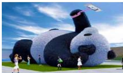
ตุ๊กตาแพนด้าอนเซลฟี

ระหว่างเดินทางท่านสามารถชมทัศนียภาพธรรมชาติอันงดงามของสองข้างถนนขณะที่รถแล่นผ่าน ที่มีทั้งภูเขาหิมะสูง หุบเขาธารน้ำ และทุ่งหญ้าบนที่ราบสูง หรือพักผ่อนตามอริยาศิยบนรถระหว่างเดินทาง