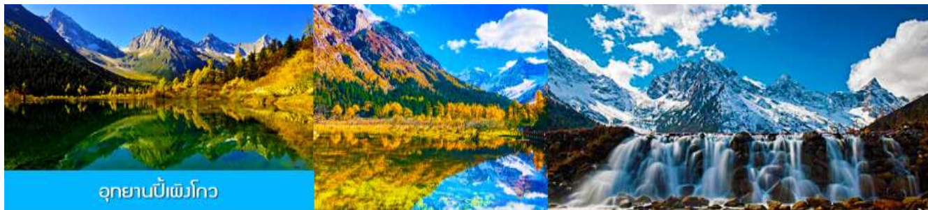
อุทยานปีฝงโกว