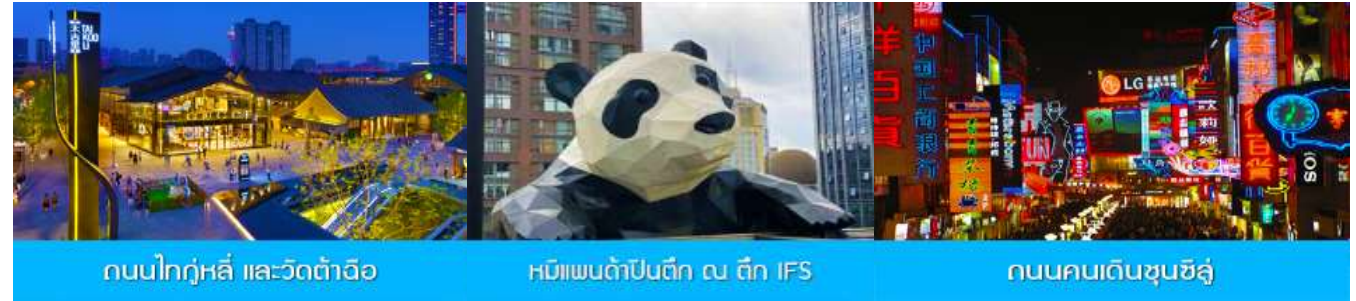
ถนนไท่กู่หลี่ และวัดต้าอ้อ