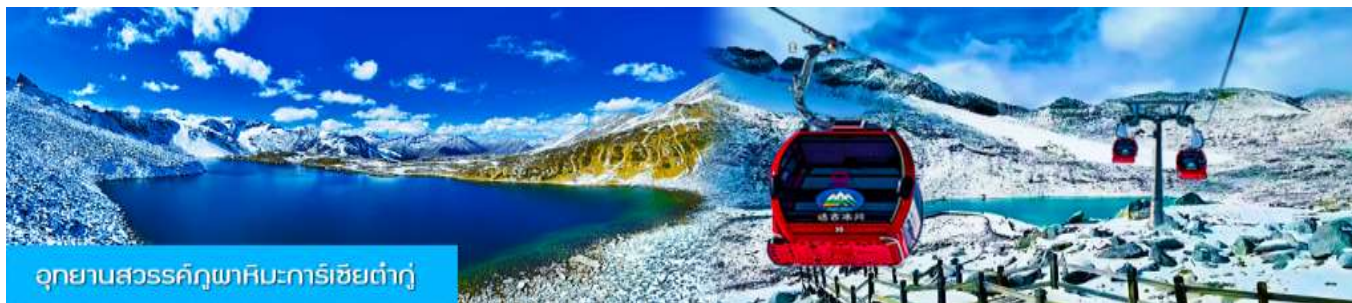
อุทยานสวรรค์ภูผาหิมะการ์เซียต้ากู่

วันที่สาม OPTIONAL TOUR อุทยานภูเขาคิมะต้ากู่ –เมืองตูเจียงเยียน– แพนด้าเซลฟี – สะพาน หนานเฉียว