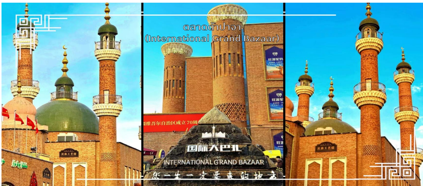
ตลาดต้าปาจา (International Grand Bazaar)

** ชำระค่าทัวร์ในนาม บริษัท นิดน้อย ทราเวล จำกัดเท่านั้น **