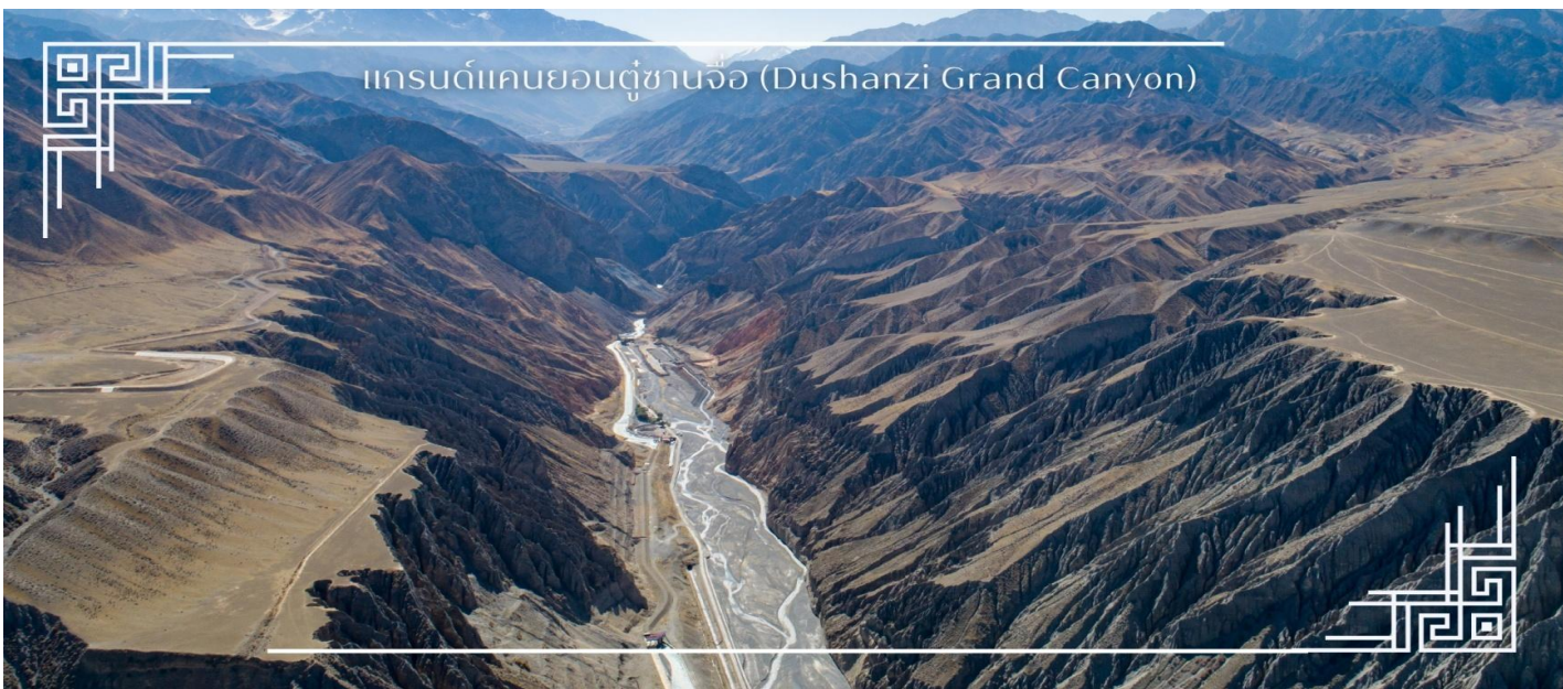
แกรนด์แคนยอนคู่ชานจี๋ (Dushanzi Grand Canyon)

นำท่านเดินทางสู่ แกรนด์แคนยอนคู่ชานจี๋ (Dushanzi Grand Canyon) หนึ่งในภูมิทัศน์ธรรมชาติอันน่าตื่นตาตื่นใจของเขตซินเจียง ที่ซึ่งธรรมชาติได้รังสรรค์พาหินสีแดงสลับชั้นอย่างงดงาม ผ่านกระบวนการกัดเซาะของลมและสายน้ำยาวนานนับล้านปี แคนยอนแห่งนี้โดดเด่นด้วยหน้าผาสูงชัน รูปทรงแปลกตา และชั้นหินหลากสีที่สะท้อนแสงอาทิตย์แตกต่างกันในแต่ละช่วงเวลา สร้างภาพทิวทัศน์ราวกับภาพวาดธรรมชาติอันยิ่งใหญ่ ท่านสามารถเดินชม วิวบนสะพานกระจก จุดชมวิวยุคใหม่ และถ่ายภาพมุมกว้างที่เผยให้เห็นความยิ่งใหญ่ของผืนแผ่นดินตะวันตกของจีน