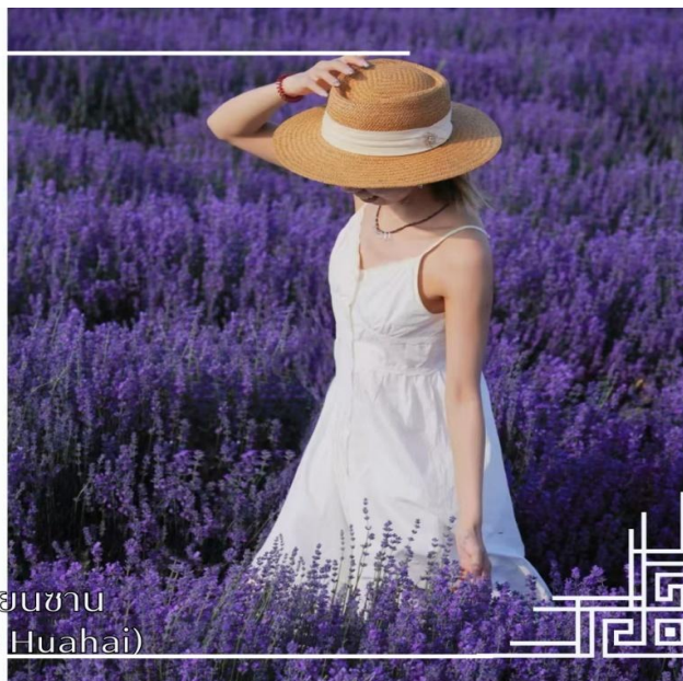
ทุ่งดอกไม้เทียนซาน (Yili Tianshan Huahai)