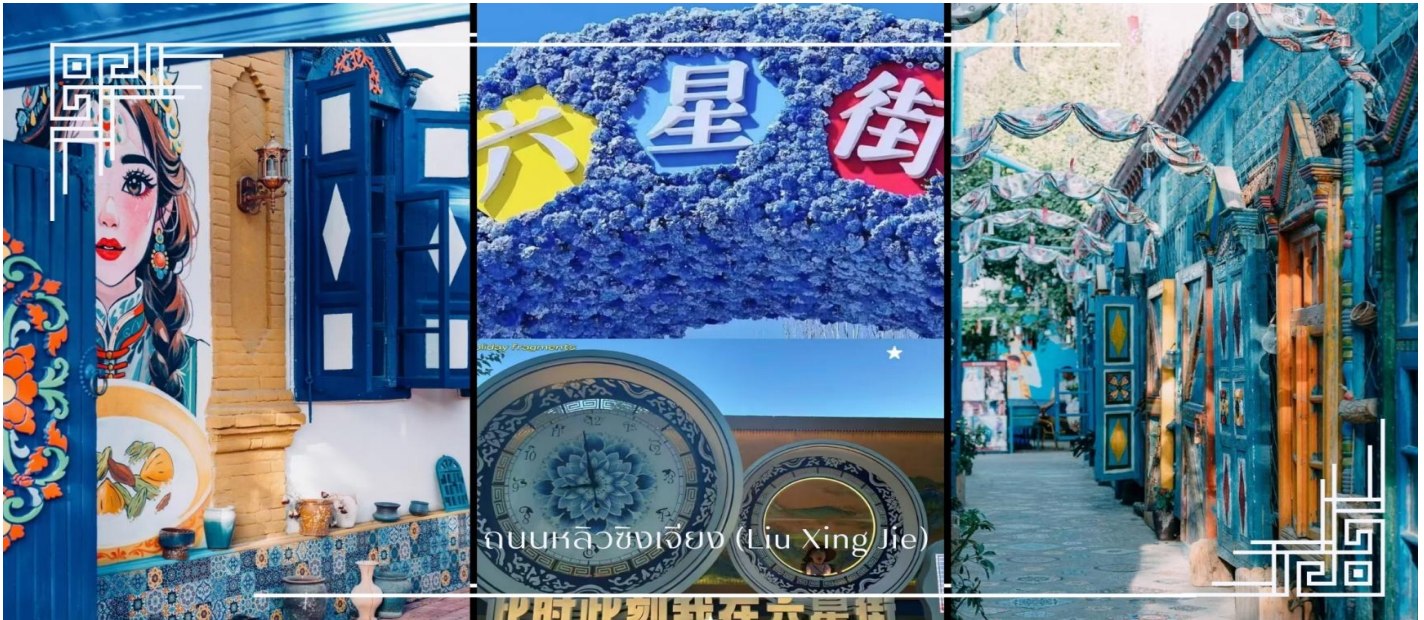
ถนนหลิวซิงเจียง (Liu Xing Jie)

** ชำระค่าทัวร์ในนาม บริษัท นิดน้อย ทราเวล จำกัดเท่านั้น **