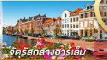
จัดสรรกลางฮาร์เล็ม