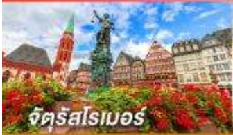
จัดสรรโมเออร์