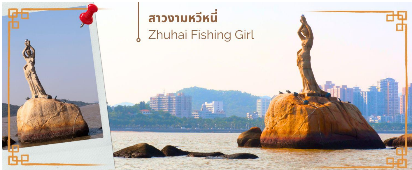
สาวงามหวีหนี่ Zhuhai Fishing Girl

📍 บริการอาหารเช้า ณ ห้องอาหารของโรงแรม (2)