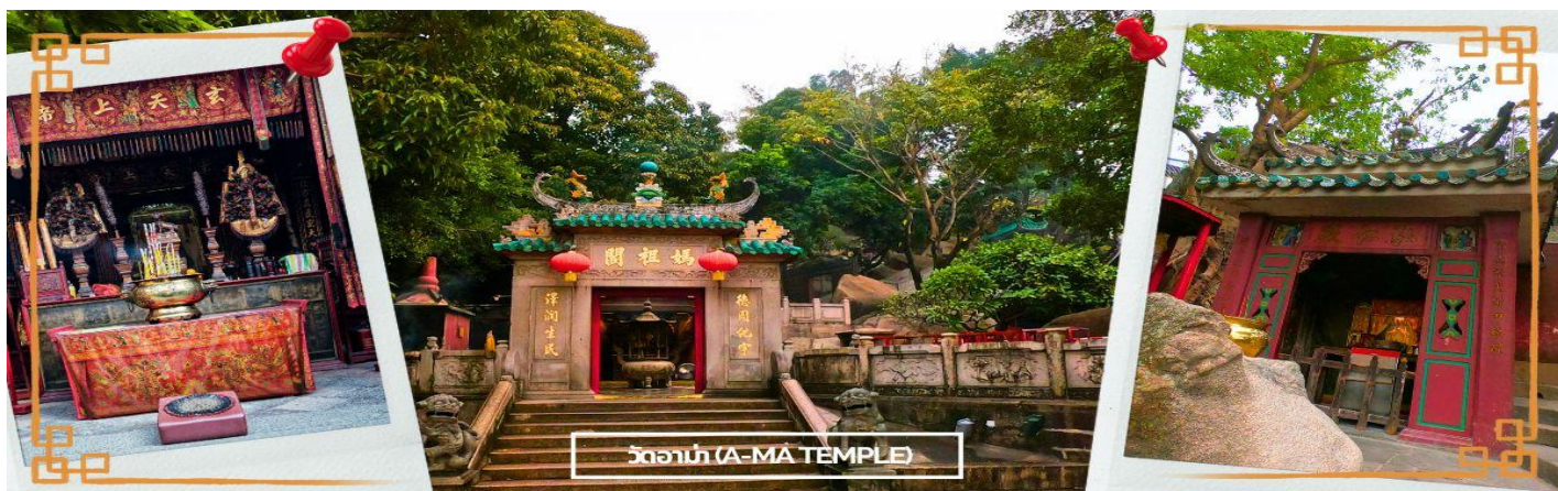
วัดอาแม่ (A-MA TEMPLE)

ให้เรือหลายลำที่เดินทางไปด้วย กันจมลงสู่ใต้ท้องทะเล ยกเว้นเรือที่มีหลินโม จนทำให้สามารถที่ สามารถเดินทางถึงฝั่งได้โดยสวัสดิภาพ และต่อมาเธอก็ได้มาเสียชีวิตลงบริเวณอ่าว A Ma วิญญาณของเธอก็มักจะคอยช่วยเหลือชาวประมงให้พ้นภัยอันตรายและปลอดภัย ผู้คนจึงเชื่อว่านางเป็นเทพธิดาแห่งท้องทะเล จึงได้สร้างวัดนี้ขึ้นเพื่ออุทิศให้แก่นางหลินโมนั้นนำท่านแวะ ร้านขนม มาเก๊า ร้านค้าใหญ่ที่รวมสิ่งของพื้นเมืองที่มีเอกลักษณ์ของมาเก๊า เช่น ขนมผิงจำ เปี้ย จำ ลูกอมรสนม นอกจากนี้ ยังเป็นแหล่งรวมสินค้านำเข้าจากอเมริกาออสเตรเลียที่ราคาถูก เนื่องจากมาเก๊าเป็นเมืองปลอดภาษี