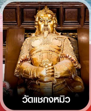
วัดเขกทมิว