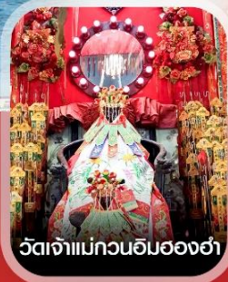
วัดเจ้าแม่กวนอิมสองฮา

✈️ คอนเฟิร์มออกเดินทาง ✈️ ทุกพีเรียด 2 ท่านขึ้นไป