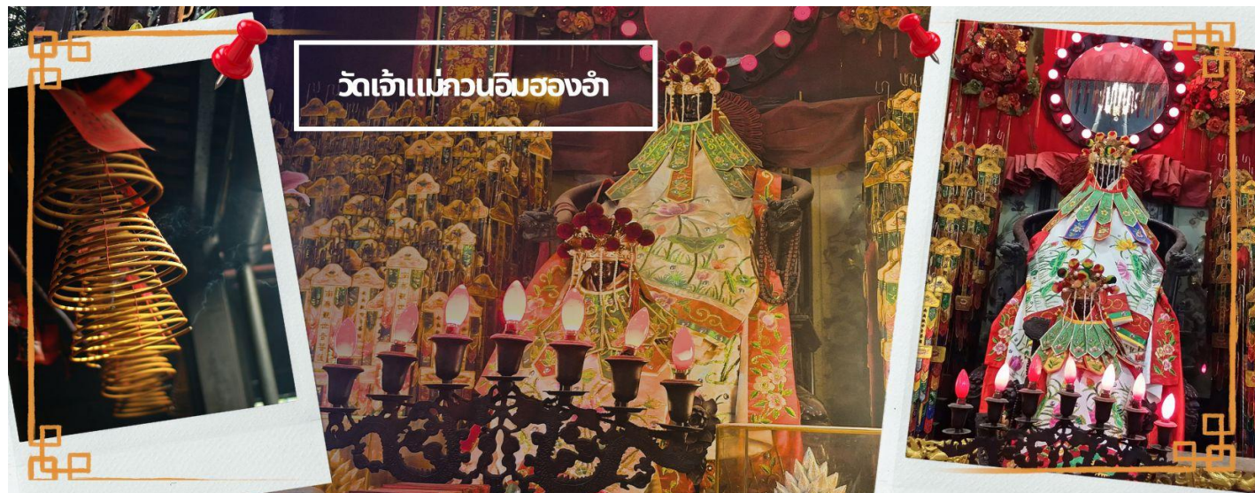
วัดเจ้าแม่กวนอิมของอ่า

** ชำระค่าทัวร์ในนาม บริษัท นิดน้อย ทราเวล จำกัดเท่านั้น **