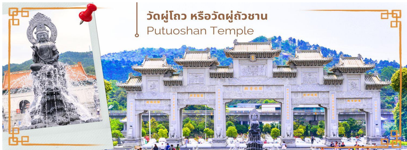
วัดผู้โถว หรือวัดผู้ถัวซาน Putuoshan Temple

จากนั้นนำท่านสู่ วัดผู้โถว หรือวัดผู้ถัวซาน (Putuoshan Temple) ดินแดนอันศักดิ์สิทธิ์ ของพระโพธิสัตว์กวนอิม พุทธศาสนานิกายมหายาน พระโพธิสัตว์กวนอิมคืออวตารหนึ่งของพระอมิตาภพุทธเจ้า ซึ่งพระโพธิสัตว์กวนอิม เป็นมหาบุรุษมีวิถนธรรมโดยรวมกว้างขวางและออกแบบด้วยรูปแบบสถาปัตยกรรมโบราณแบบดั้งเดิม ที่จำลอง มาจากเกาะผู้โถ้วซาน ลงมาสู่ดินแดนแห่งท้องทะเลใต้ แห่งนี้