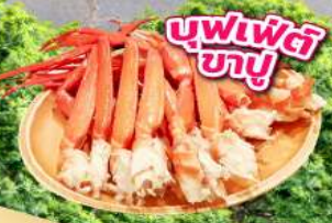
บุฟเฟ่ต์ ซาซุ