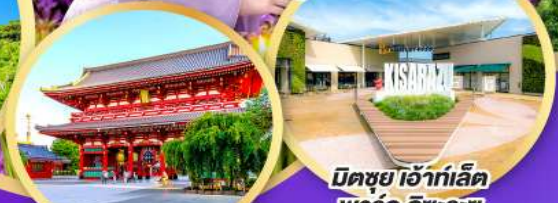
มิตซูเอะ อิฮาร่า เล็ต พาร์ค คิซะระชู