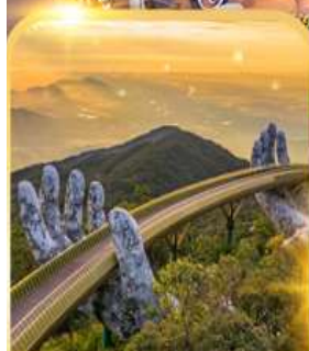
สะพานมือยักษ์