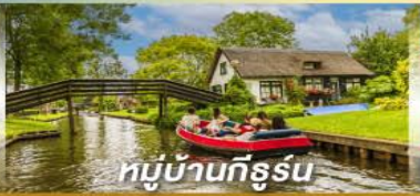
หมู่บ้านทีธูร์น