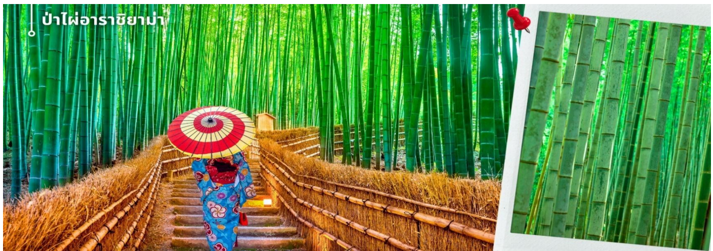
ป่าไผ่อาราชิยาม่า

จากนั้นนำท่านเดินทางสู่ ป่าไผ่อาราชิยาม่า ซึ่งอยู่ไม่ไกลจากสะพานโทเก็ตสึเคียว ป่าไผ่แห่งนี้ เป็นป่าไผ่ที่ใหญ่ที่สุดในญี่ปุ่น ทั้งสวยและโด่งดังที่สุดในประเทศญี่ปุ่น โดยตลอดสองข้างทาง นั้นจะมีต้นไผ่สีเขียวสูงเสียดฟ้า ยาวกว่า 10 เมตร เรียงรายอยู่เป็นระยะทางประมาณ 500 เมตร ที่จะทำให้เราได้ดื่มด่ำไปกับเสียงต้นไผ่ที่กระทบกัน ให้ความรื่นรมย์ สงบ เย็นสบาย