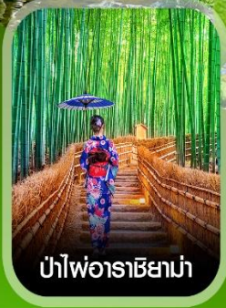
ป่าไผ่อาราชิมาม่า