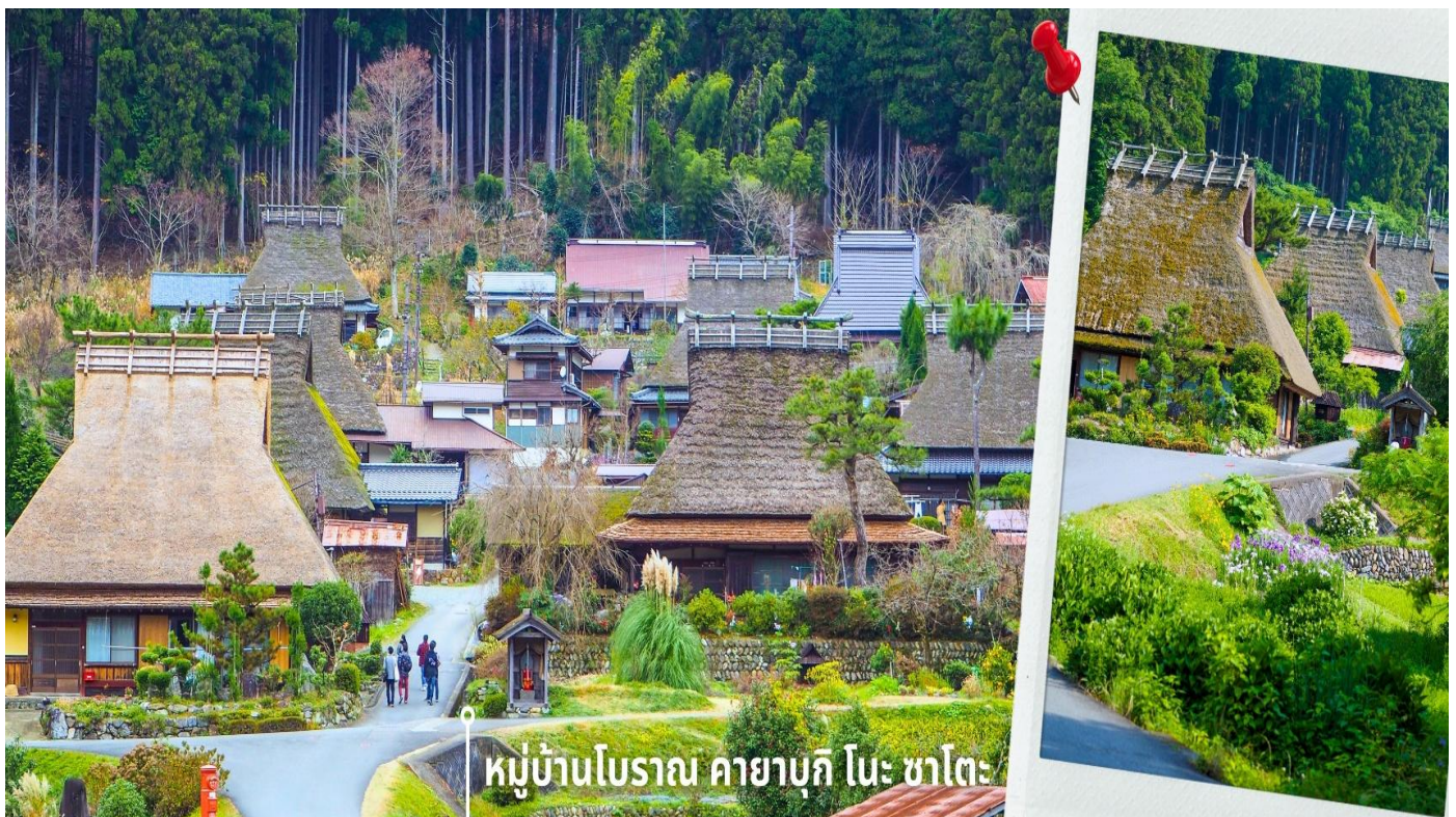
หมู่บ้านโบราณ คายาบูกิ โนะ ซาโตะ

** ชำระค่าทัวร์ในนาม บริษัท นิดน้อย ทราเวล จำกัดเท่านั้น **