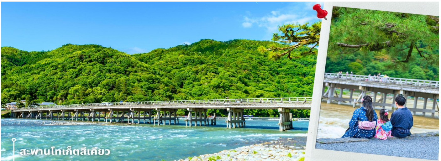
สะพานโทเก็ตสึเคียว

จากนั้นนำท่านสู่ สะพานโทเก็ตสึเคียว ตั้งอยู่ในบริเวณอาราชิยาม่า จังหวัดเกียวโต เป็น สะพานข้ามแม่น้ำคิตสึระ (Katsura River) ตัวสะพานโทเก็ตสึเคียวดั้งเดิมนั้นเป็นสะพานไม้ กังหมัด สร้างขึ้นในปี ค.ศ. 836 ส่วนสะพานที่เห็นในปัจจุบันนั้นสร้างขึ้นเมื่อปี ค.ศ. 1934 มีความยาว 155 เมตร และความกว้าง 12.2 เมตร โดยมีการสร้างให้ช่วงฐานเป็นคอนกรีต เสริมเหล็ก แต่ยังคงใช้ราวสะพานไม้เพื่อคงเอกลักษณ์ดั้งเดิมไว้ ที่สะพานแห่งนี้ ท่านจะได้ สัมผัสบรรยากาศธรรมชาติที่รายล้อมไปด้วยต้นไม้เขียวชะอุ่ม ทั่วบริเวณโดยรอบ สูดอากาศ อุ่นสดชื่น และชมวิวธรรมชาติที่งดงามอย่างเต็มที่ ให้ท่านอิสระเก็บภาพความสวยงามและดื่ม ด่ำกับบรรยากาศตามอัธยาศัย