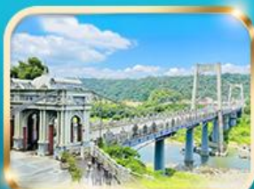
สะพานต้าซี เกาหยวน