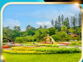
สวนบ้านป른.เจียงไคซิก