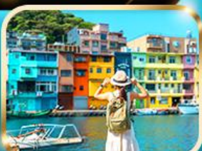
หมู่บ้านประมงจิ้งปิ่น

** ชำระค่าทัวร์ในนาม บริษัท นิดน้อย ทราเวล จำกัดเท่านั้น **