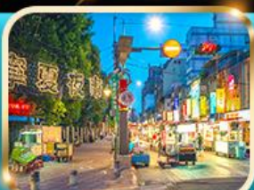
หนิงเซี่ย ไทน์มาร์เก็ต