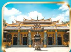
วัดต้าซี ขอความรอย