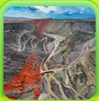
"แกรนด์แคนยอนคู่ชาวจื่อ"

ซินเจียงเหนือ ทะเลสาบโซลุ่มู่ "น้ำตาหยดสุดท้ายของแอตแลนติก" • ทุ่งหญ้านาราตี ทุ่งดอกไม้เทียนซาน • ผ่านชมสะพานกั๋วจื่อโกว • ถนนหลิวซิงเจียง • ตลาดต้าปาจา