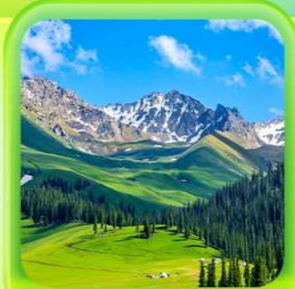
"ทุ่งหญ้านาราตี"