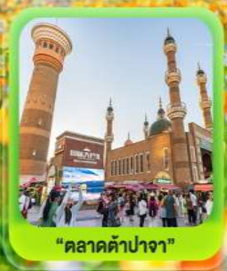
"ตลาดต้าปาจา"

รวมรถไฟความเร็วสูง 1 ทา (อ๋หนิง - อูรูมู่ดี)