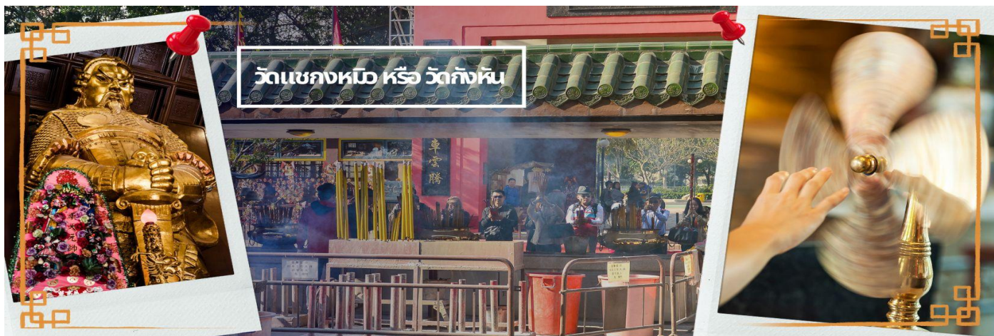
วัดเขกงหนือ หรือ วัดกังหัน

ๆ ครั้ง ท่านใช้สัญลักษณ์รูปกังหัน 4 ใบพัดติดไว้ด้านหน้ารถศีกนำงบวณในกองทัพ เหล่าทหารกล้ามีความเชื่อว่าเมื่อพกพาสัญลักษณ์รูปกังหันนี้ไป ณ ที่ใด ๆ กังหันนี้จะช่วยเสริมสิริ