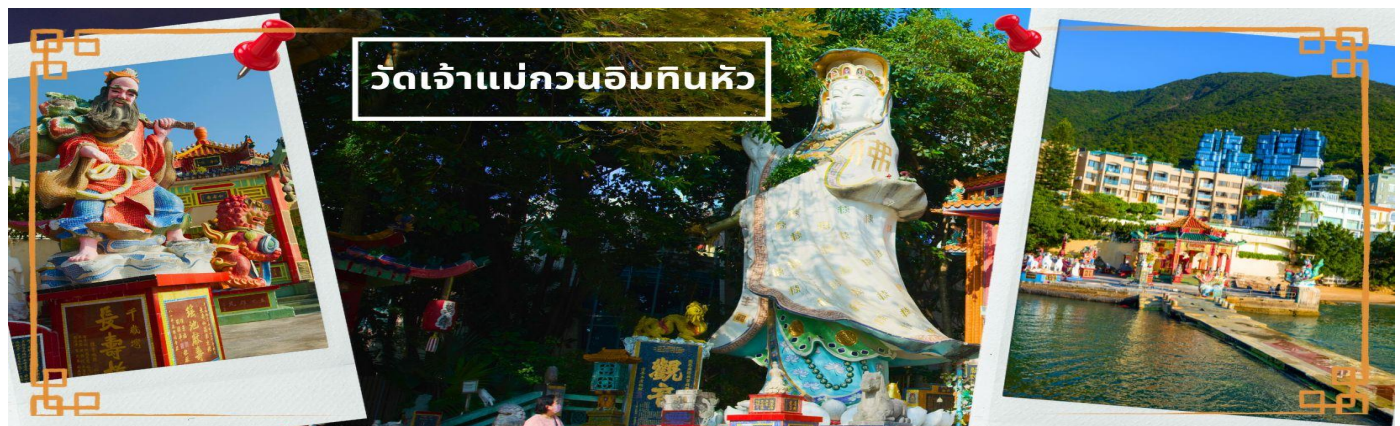
วัดเจ้าแม่กวนอิมกินหัว

เช้า ☉ บริการอาหารเช้า ณ ภัตตาคาร **เมนูต้มยำต้นตำหรับฮ่องกง** (3) จากนั้นนำท่านเดินทางสู่ วัดเจ้าแม่กวนอิมกินหัว อ่าวรีพลัสเบย์ (TIN HAU TEMPLE REPULSE BAY) ตั้งอยู่ริมทะเล เป็นสถานที่ท่องเที่ยวสำคัญ สร้างขึ้นในปี ค.ศ.1993 วัด แห่งนี้ถูกสร้างขึ้นเพื่อคุ้มครองชาวประมงในการออกเรือไปหาปลา ซึ่งเป็นหนึ่งในวัดที่เก่าแก่ ที่สุดของฮ่องกง บริเวณวัดจะมี เจ้าแม่กวนอิมองค์ใหญ่ ประสงค์ประทานพรตั้งอยู่ เป็นเทพที่ ชาวฮ่องกงและคนจีนให้ความเคารพนับถือมากที่สุด สามารถขอพรได้ทุกเรื่อง วัดนี้เป็นที่ นิยมมีนักท่องเที่ยวเดินทางมาขอพรกันมากมาย เพราะเชื่อในความศักดิ์สิทธิ์ และยังมีเจ้าแม่ กับทิม หรือเทพธิดาแห่งท้องทะเลองค์ใหญ่ ซึ่งคนฮ่องกง คนมาเก๊า และคนจีน ที่อยู่ริมทะเล ชาวประมง นักเดินเรือหรือผู้ที่เดินทางทางเรือเป็นประจำ จะนับถือเจ้าแม่กับทิมเป็นอย่างมาก มีความเชื่อว่าเจ้าแม่กับทิมจะปกป้องเราจากภัยอันตรายระหว่างการเดินทาง ภายในวัดยังมี เทพเจ้าและพระพุทธรูปต่างๆ ประดิษฐานไว้มากมายตามความเชื่อถือศรัทธา เช่น เทพเจ้าไฉ่