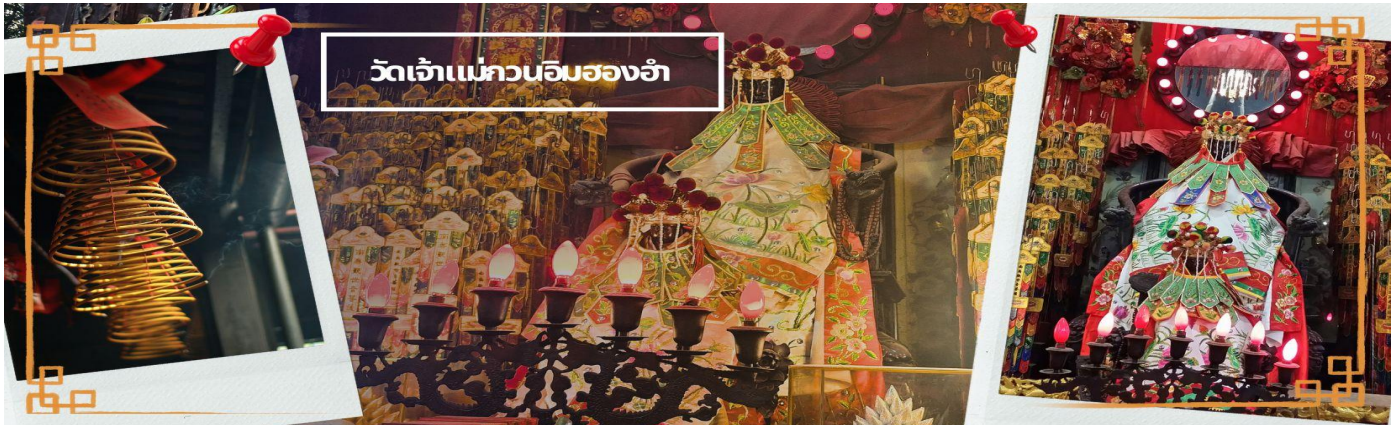
วัดเจ้าแม่กวนอิมอ่องฮ่า

ฉะนั้นเมื่อใครมีเรื่อง ทุกข์ร้อนอะไรก็มักจะมากราบไหว้ขอพรให้เจ้าแม่ช่วยเหลือ วัดนี้ถูกสร้างขึ้นในปี ค.ศ.1873 ในช่วงสงครามโลกครั้งที่ 2 มีการปล่อยระเบิดลงบริเวณวัดอ่องฮ่าหลายต่อหลายครั้ง ทำให้มีผู้บาดเจ็บและล้มตายมากมาย แต่ชาวบ้านที่หนีเข้าไปหลบภัยในวัดนี้กลับปลอดภัยและตัววัดก็ไม่ได้ได้รับความเสียหายจากเหตุการณ์ทิ้งระเบิดอย่างน่าอัศจรรย์ และวันสำคัญอีกวันหนึ่งที่คนหลังไหลมาไหว้ขอพรอย่างไม่ขาดสาย และรอคอย