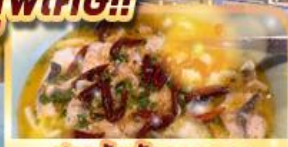
ปลาต้มพริกทอดดอง