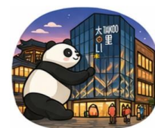
ถนนคนเดินไท่กู่หลี่ (Taikoo Li)

ค่ำ บริการอาหาร ณ ภัตตาคาร พิเศษ ... เมนูสุกี้หม่าล่า ที่พักCHUNBO INT HOTEL เกียบเท่าหรือระดับ 4 ดาวท้องถิ่น