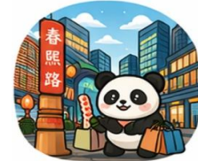
ถนนคนเดินชุนซีลู่ (Chunxi Road)

OPTION : ล่องเรือแม่น้ำจั้นเจียงชมวิวเมืองเจิ้งตูยามค่ำคืน ราคาประมาณ 300 หยวน/ท่าน ขึ้นอยู่กับความสมัครใจ โปรดติดต่อสอบถามได้จากมัคคุเทศก์ท้องถิ่น